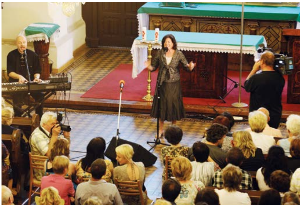
V HRUŠOVĚ. Benefiční koncert na záchranu hrušovského kostela 17. 6. 2012.

Přála bych jim všechno to, co se přeje do Nového roku. Hlavně hodně štěstí, zdraví, fandovství a lásky k Ostravě.