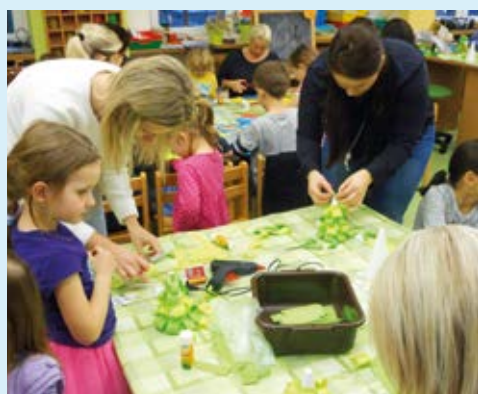
TVOŘENÍ. Výroba ozdob v MŠ Komerční.