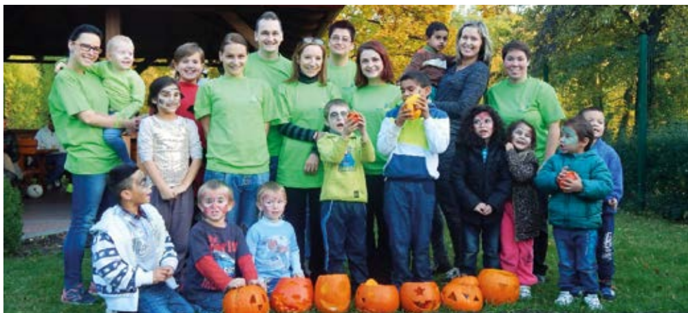
STRAŠIDELNÉ ODPOLEDNE. Slavnost v Azylovém domě pro rodiny s dětmi.