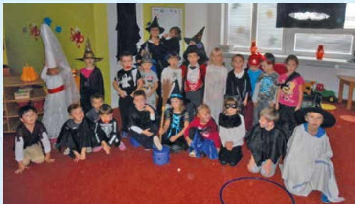
KOBLOV. Halloweenská párty v mateřské škole.

Děti ručně vyrobené lampiony, dobroty od maminek, plná mísa ovoce, zábava v plném proudu a strašidla kam oko dohlédlo. Tak to žilo jedno listopadové dopoledne v MŠ Koblov na Halloweenské párty.