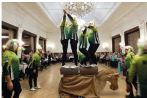
140. Tolik seniorů přišlo na ples pořádaný městským obvodem.