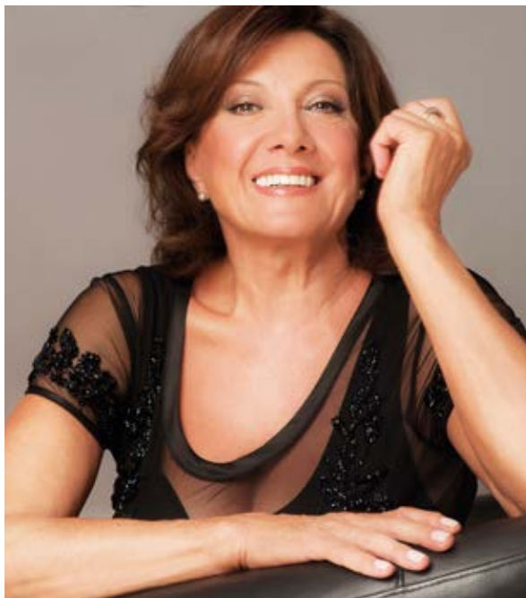
MARIE ROTTROVÁ. Rodačka z Hrušova je nyní na velkém turné Galakonzert.

Rodačka z Hrušova Marie Rottrová zpívala v zaplněném vítkovicím Gongu 18. listopadu. Den poté vznikl rozhovor nejen o vzpomínkách na mizející slezskoostravskou čtvrť.