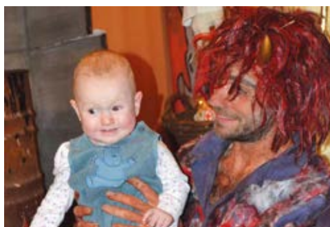
NADÍLKA. Čert v Muglinově.