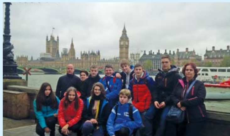
OXFORD. Do Oxfordu vyjeli i žáci ZŠ Chrustova.