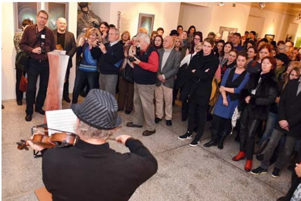
IN SIGNUM. Jedenáct výtvarníků vystavuje sedm desítek prací.