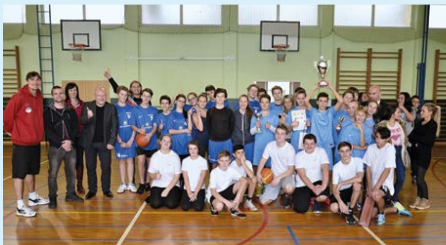
TURNAJ. Pohár radnice Slezské Ostravy získala ZŠ Bohumínská.