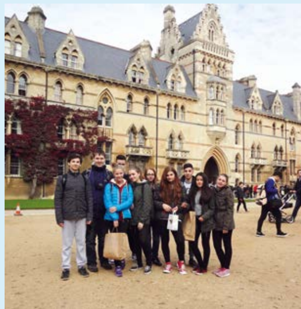
OXFORD. ZŠ Pěší v kolébce vzdělanosti.

V říjnu se žáci ZŠ Pěší zúčastnili zahraničního jazykově-vzdělávacího pobytu v anglickém Oxfordu, kolébce vzdělanosti. Umožnil jim to projekt Šance pro zvýšení kvality a efektivity vzdělání zaměřený na podporu výuky cizích jazyků. Projekt je dotován ze strany Ministerstva školství mládeže a tělovýchovy v rámci výzvy č. 56 z Operačního programu Vzdělávání pro konkurenceschopnost.