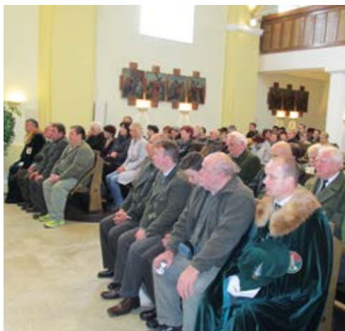
SVATOHUBERTSKÁ MŠE. Myslivci v heřmanickém kostele.

Dne 18. října se uskutečnila v kostele svatého Marka v Ostravě-Heřmanicích Svatohubertská mše. Tato mše patří k mysliveckým tradicím, kterou bychom chtěli obnovit. Historicky první mše byla v Heřmanicích konána v roce 2014. Pro její kladné přijetí jsme se rozhodli ji v tomto roce znovu opakovat.