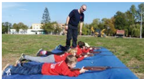
ÚSPĚCH. Dvě první místa ve dvou závodech získali muglinovští hasiči.

V měsíci říjnu se uskutečnily dva závody požárníkové všestrannosti, neboli branné závody, kde družstva soutěží na stanovištích ve svých znalostech z topografie, požární ochrany, zdravotví, uzlování a také ve střelbě ze vzduchovky nebo překonání lanové překážky.