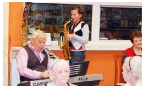
VÁNOČNÍ BESÍDKA. Přání seniorům v DPS Hladnovská.

Pro všechny zúčastněné bylo připraveno drobné pohoštění. Senioři byli obdarováni malým vánočním dárkem. Příjemnou vánoční atmosféru navodilo hudební a pěvecké vystoupení dvou malých slečen, které zazpívaly písničky,