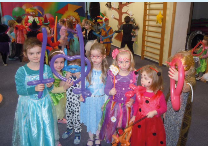
KARNEVAL. Prostory školy jako pohádkové království.

Kolektiv zaměstnanců MŠ Komerční a odloučeného pracoviště MŠ Jaklovecká