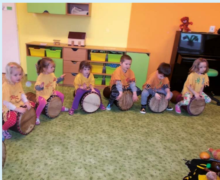
BUBNOVÁNÍ. Děti zkoušely hry na nejrůznější nástroje.