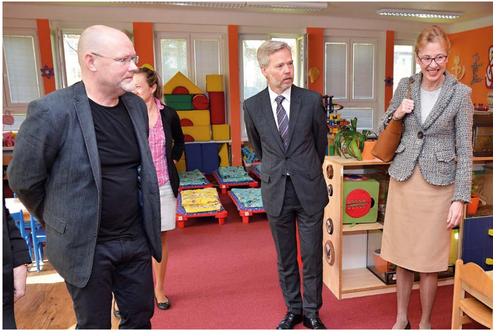
NÁVŠTĚVA. Velvyslankyně Norska Siri Ellen Sletner, mluvčí velvyslanectví Terje B. Englund a místostarosta Roman Goryczka /zprava/ při prohlídce MŠ Chrustova.

Velvyslankyně Norského království Siri Ellen Sletner navštívila v úterý 5. dubna mateřskou a základní školu v Chrustově ulici ve Slezské Ostravě.