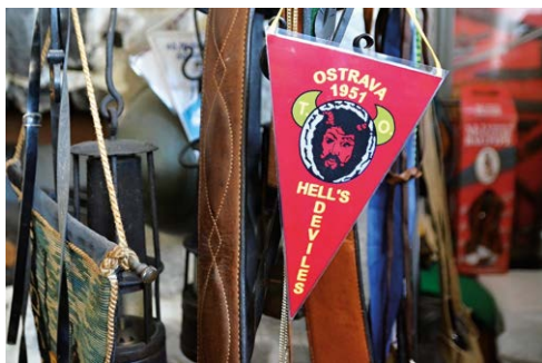
HELL'S DEVILES. Už 65 let ve Slezské Ostravě.