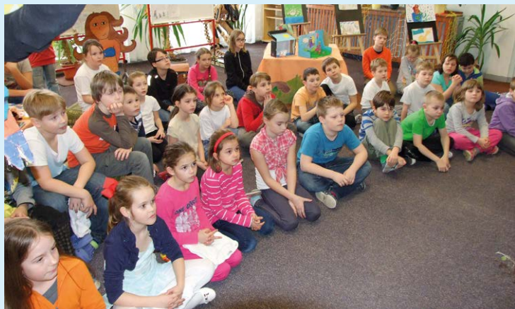
POHÁDKOVÁ NOC. Děti prožívaly dobrodružství ve škole.