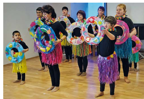
KONFERENCE. O dětech s Downovým syndromem.