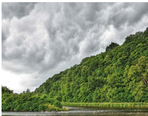
SOUTOK. Řeky Odry a Ostravice pod Landekem.

Žít pod Landekem znamená žít nejen téměř doslova na konci světa (Land-Ecke), ale rovněž žít mezi světy. V půdních vrstvách Landeku je nejen vepsána nejstarší historie, ale také z geografického hlediska je Landek ojedinělý – je posledním výběžkem České vysočiny, na severním okraji Moravské brány. Právě zde, pod Landekem, se „české hory“ lámou v Karpaty; jinými slovy řečeno, na tomto místě se Západ střetává s Východem. Je to hraniční místo, které můžeme vnímat nejen jako zemi pravěkou (zemi lovců mamutů), jako Moravu (do středověkého konstituování Slezska), jako Pruské Slezsko čili „prajzkou“ (od roku 1742 do roku 1870), jako Německé císařství (do roku 1918), jako Výmarskou republiku (do roku 1920), ale také jako Československo (do roku 1938), posléze Třetí říši (do roku 1945), po válce opět jako Československo (do roku 1993) a nyní jako součást Česka – a také součást městského obvodu Slezská Ostrava.