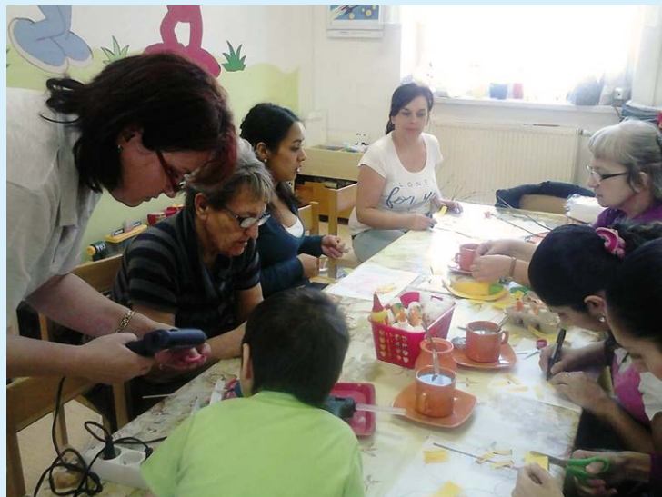
DÍLNIČKY. Mateřská škola a Velikonoce.