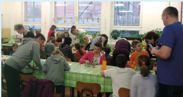
TRADICE. Celkem 31 dětí vyrábělo velikonoční ozdoby.