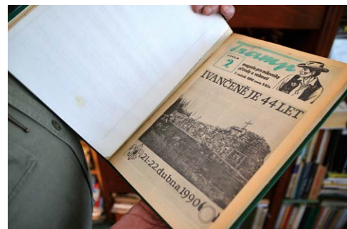
ČASOPIS. S přestávkami vyšel Tramp 127 krát.