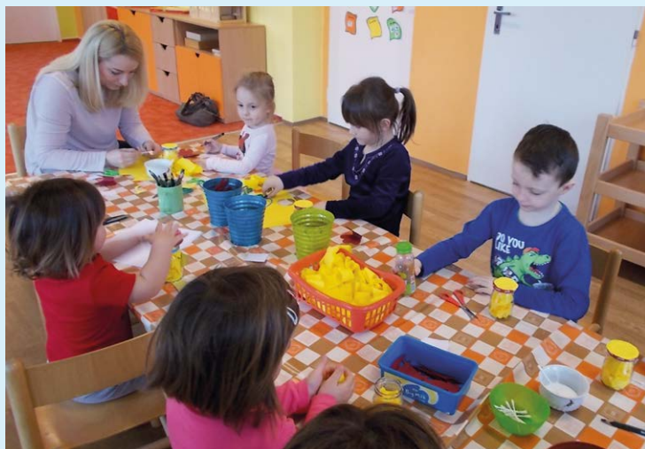
TVOŘENÍ. Rodiče i děti pilně pracovali.