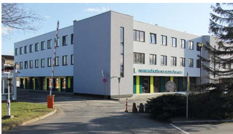
PO REKONSTRUKCI. Budova Technických služeb.

Do soutěže se přihlásilo celkem devět objektů. Společnost Technické služby, a.s. Slezská Ostrava vsadila na samotné technické provedení a zejména pak přínos pro životní prostředí a velkou úsporu energií. Nutno podotknout, že oproti ostatním přihlášeným stavbám byla společnost finančně omezena výší dotace. Na základě hodnocení odborné komise a rozhodnutím Rady města ze dne 22. března se administrativní budova Technických služeb, a.s. Slezská Ostrava neumístila na prvních dvou oceněných místech, přesto všechno pro