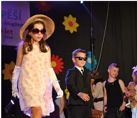
AKADEMIE ZŠ PĚŠÍ. Muglinovská škola si připomněla 120 let svého trvání.

Výuka na naší škole byla poprvé zahájena 5. 9. 1896. Letos v září tedy přivítáme nový školní rok po 120. A to už je opravdu důvod k oslavám!