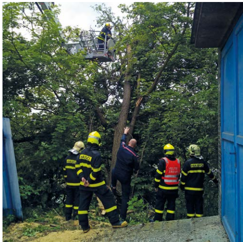
LIKVIDACE. Hasiči odklízejí strom na Dědičné ulici.