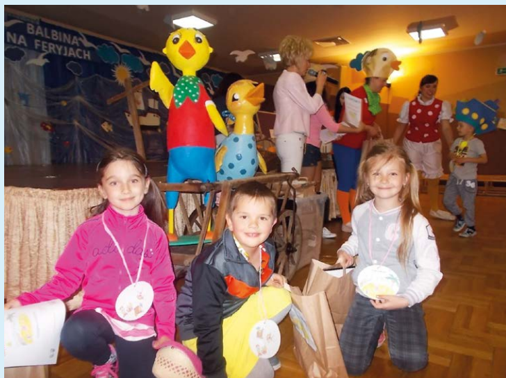
SETKÁNÍ. Děti si užily bohatý program plný her.