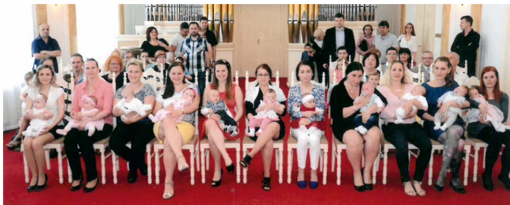
VÍTÁNÍ. Maminky s dětmi v obřadní síni radnice.