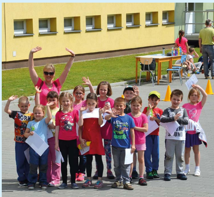
PRVNĀCI. Především nejmenší žáci slavili Den dětí.