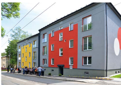
REKONSTRUKCE. Dům na ulici Heřmanická v roce 2015 a 2016.

Nový Komunitní dům seniorů otevřel městský obvod Slezská Ostrava na ulici Heřmanické. Dům má 17 bytů a od 1. června jej začali využívat senioři starší šedesátí let.