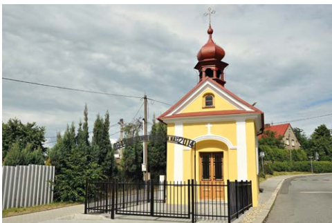
OPRAVY. Opravená kaple v Muglinově a nové interiéry bytů v DPS Hladnovská.

Největší a nejnáročnější zakázkou byla oprava devíti volných bytových jednotek v Domě s pečovatelskou službou Hladnovská 119a, Ostrava-Muglinov. V rámci oprav se prováděla celková oprava koupelen se změnou dispozice, výměna elektroinstalace, rozvodů vody a odpadů, obkladů a dlažeb, zařizovacích předmětů, kuchyňských linek, podlahových krytin a malby a nátěry. Při návrhu nových dispozic koupelen byly respektovány požadavky klientů a pracovníků pečovatelské služby - instalovala se závěsná WC a místo van se zřizovaly sprchové kouty se zástěnami. Tři z bytů jsou řešeny jako bezbariérové pro osoby s omezenou schopností pohybu - v těchto bytech jsou mimo jiné instalovány atypické rohové kuchyňské linky v provedení pro