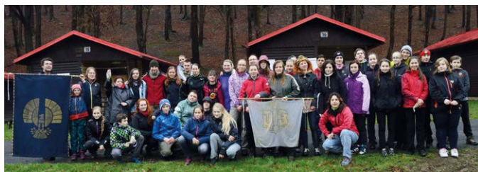
AKČNÍ VÍKEND. Mládež ze Slezské vyrazila do Kajlovce na Opavsku.

V den odjezdu se účastníci scházeli na nádraží Ostrava-Vítkovice, kde proběhlo losování dvojic a určení kraje, který budou zastupovat. Přesunuli se vlakem do Kajlovce, zde pro-