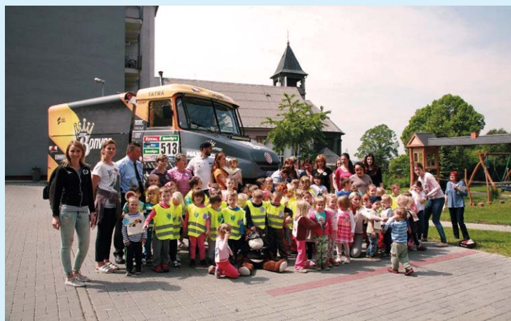
PŘED TATROU. Projekt Hrajeme si, tvoříme a poznáváme svět.