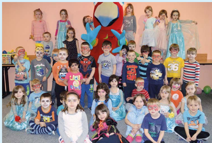
YDAŘENÝ ROK. Plno dobrodružství v mateřských školách.