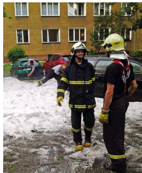
ZÁSAH. Dobrovolní hasiči z Heřmanic vyjeli na pomoc.