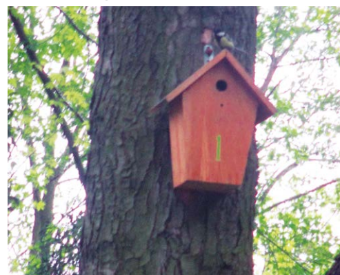
OBSAZENO. Ve všech budkách v parku se zabydleli ptáci.