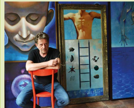
MARTIN NĚMEC. Známy hudebník připravuje výstavu ve Slezské Ostravě.