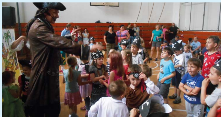
PIRÁTI. Dobrá nálada v Kobloušce.