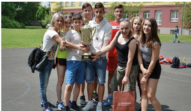
VÍTEZOVÉ. Titul získala ZŠ Bohumínská.