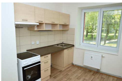
INTERIÉR. Vzniklo 17 moderních bezbariérových bytů.