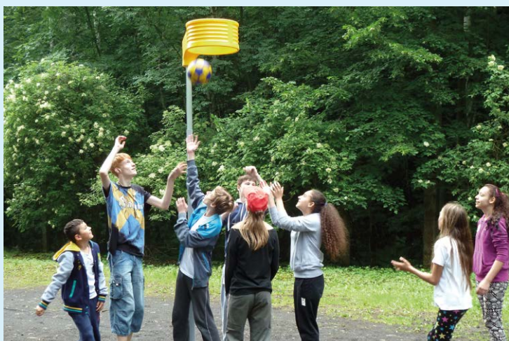
LANDEK. Vydařená oslava.