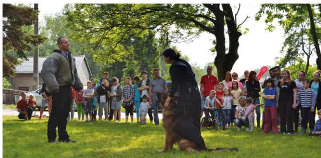
VYDAŘENÉ ODPOLEDNE. Program pro děti se v Muglinově konal 29. května.

Letošní ročník „Dětského odpoledne“, které každoročně pořádá Kultura pro Slezskou Ostravu, z.s., za podpory městského obvodu Slezská Ostrava, se i přes počáteční nepřízeň počasí opět vydařil.