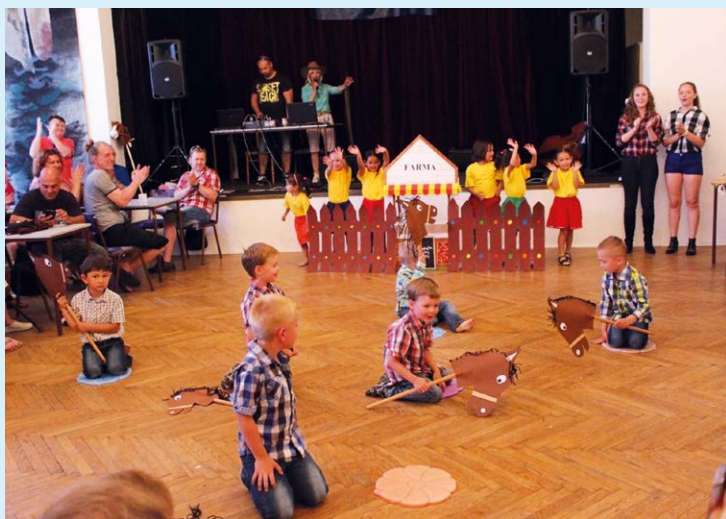
MINICOUNTRY FESTIVAL. Tanečky v MŠ Bohumínská.