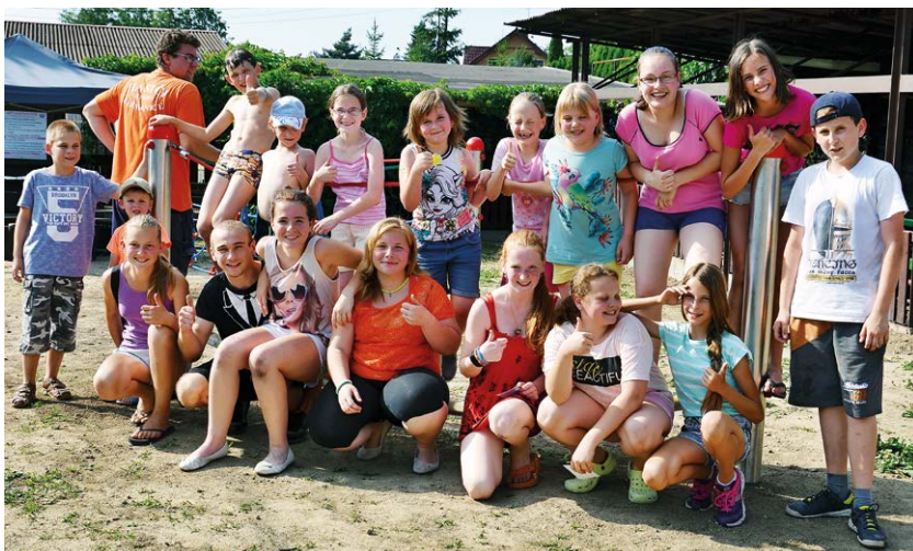
PRO DĚTI. V Heřmanicích vzniklo nové hřiště.

Bc. Silvie Šeděnková, vedoucí mládeže SDH Ostrava-Heřmanice