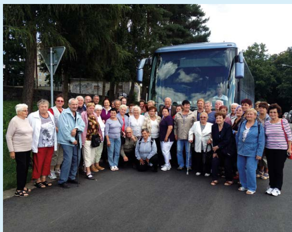
ZÁJEZD. Seniori ze Slezské vyrazili na jižní Moravu.