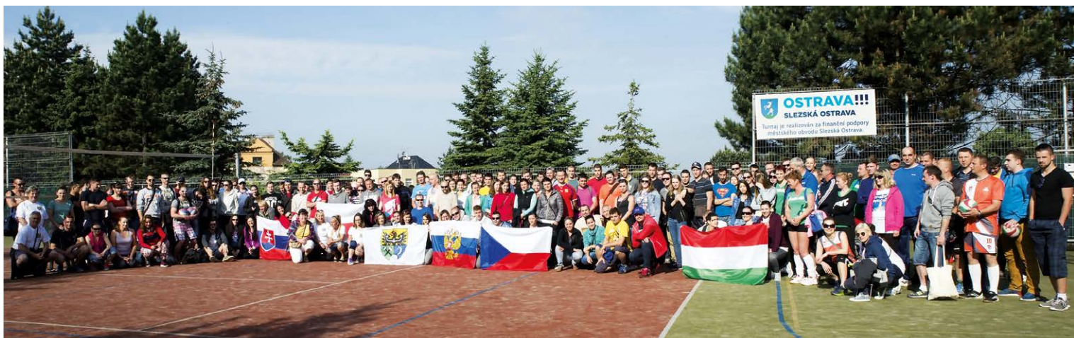
ČTYŘICET TÝMŮ. Osmý ročník volejbalového turnaje se konal v areálu hladnovského gymnázia.