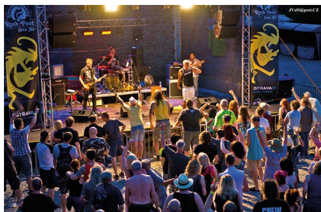
ROCK-FEST. Nejstarší ostravský rockový festival na Slezskoostravském hradě.