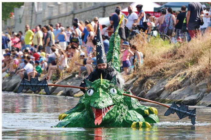
ČARODĚJ. První cenu v soutěži netradičních plavidel získal muž, který sjel řeku Ostravici na drakovi.