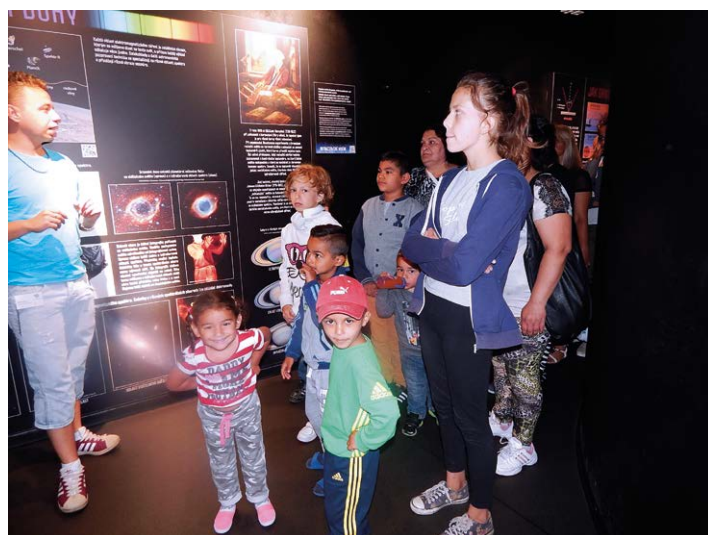
V PLANETÁRIU. Děti navštívily také unikátní ostravské zařízení.