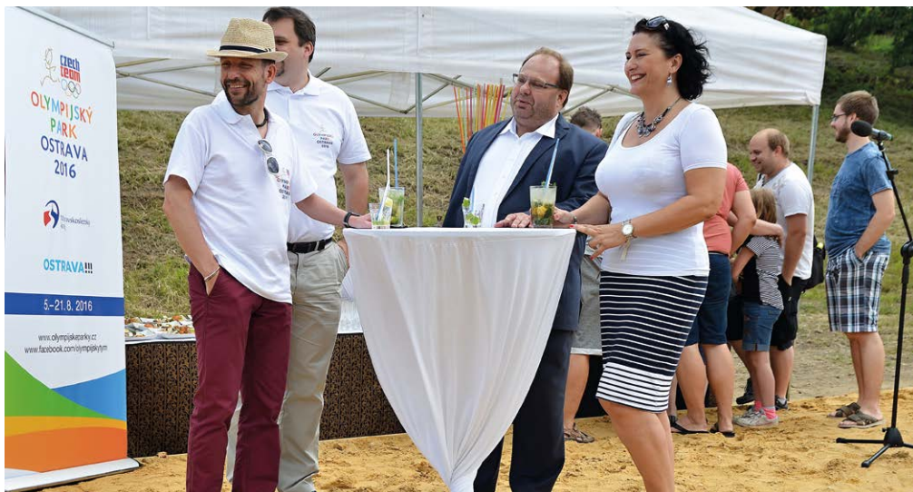
ZAHÁJENÍ. Slavnostní otevření pláže ve Slezské Ostravě se konalo 1. července.

Historicky první písečná pláž vznikla v blízkosti Hradní lávky a loděnice na slezskoostravském břehu řeky Ostravice. Nabídla relaxaci u řeky, lehátka a atmosféru letní pohody. Od 6. do 21. srpna se pláž stala součástí Olympijského parku Ostrava.