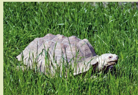
/red/ Želva ostruhatá.

Dvě nové expozice byly otevřeny v letních měsících v ZOO Ostrava. Africká zvířata s noční aktivitou jsou nyní k vidění v expozici Noční Tanganika. Nová je také expozice pro želvy ostruhatá - třetí největší suchozemské želvy. S budováním nových expozic souvisí nárůst počtu druhů i chovaných zvířat. Počet druhů v Ostravě už narostl na více než 400 a celkový počet zvířat nedávno překročil hranici čtyř tisíc.