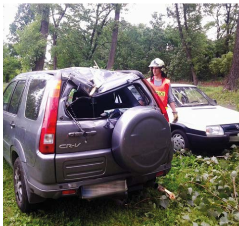
ZÁSAH. Silný vítr zaměstnal hasiče i jejich techniku.