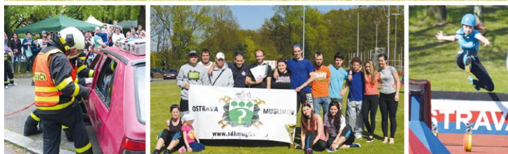
V AKCI. Činnost hasičů v Muglinově je bohatá.

Obdobně jako děti, soutěží za Muglinov i týmy mužů a žen. Oba týmy již mají za sebou několik letošních závodů a úspěch se dostavil třeba v podobě vítězství v Hrbové. Více o naší činnosti se dozvíte na webu www.sdhmuglinov.cz .