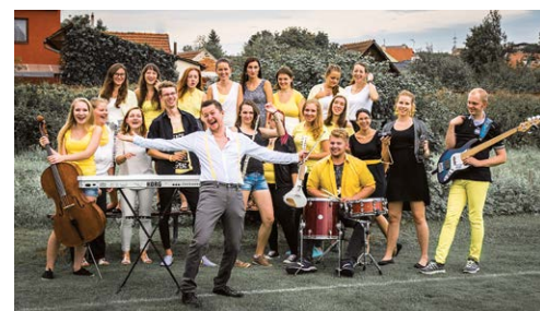
GOOD WORK. K vidění a slyšení na festivalu Slezská lilie.

Závěrečný festivalový den 11. 6. bude probíhat v Ostravě-Kunčičkách. Tradiční mši svatou doplní vystoupení MATE.O/TU či skupina Záblesk. Návštěvníci se mohou těšit na Guy Gilberta - jedinečného francouzského římskokatolického kněze, který se proslavil svou prací s delikventní mládeží.