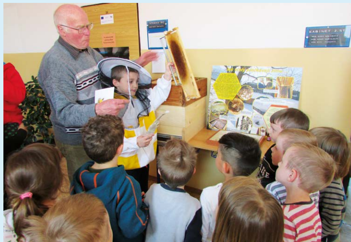
PAN VČELAR. Ukázky práce s včelstvem.