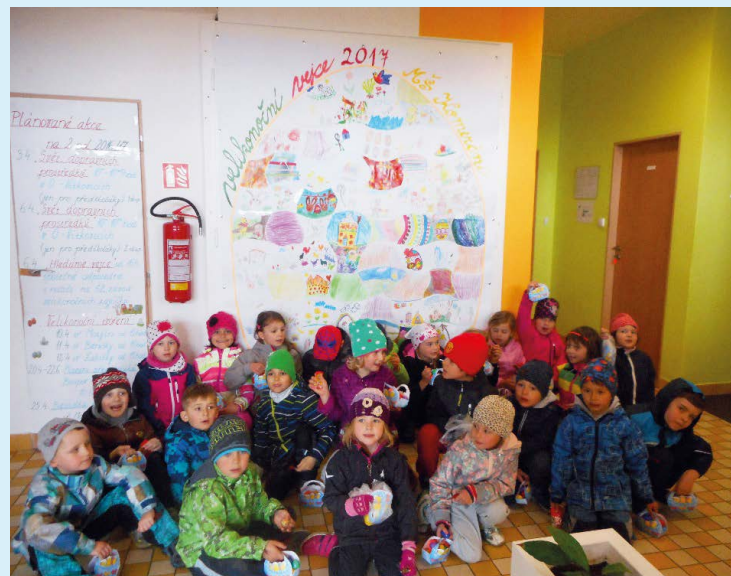
SKLÁDAČKA. Děti o Velikonoce tvořily.