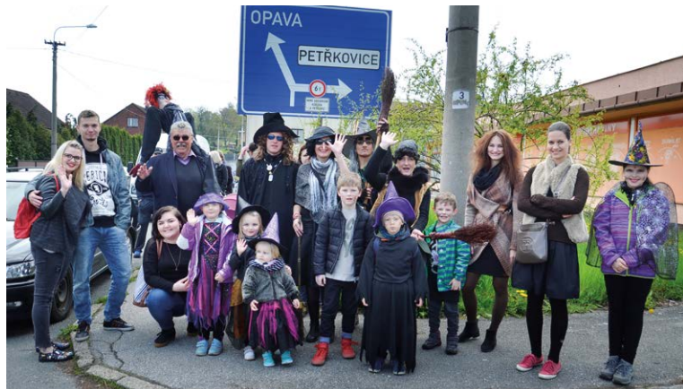
KOBLOVSKÝ SLET. Děti čekal průvod, později hrát na sokolském hřišti.

Antošovická. „Je zapotřebí poděkovat celému týmu, který se svých povinnostech zhostil na výbornou,“ konstatuje Pišťák. Večer na hřišti vzplála svépomocí vyrobená moréna. S akcí pomáhali koblovští dobrovolní hasiči i městští policisté. Sletu se zúčastnily desítky dětí z celé Slezské Ostravy i vzdálenějších obvodů. Organizátoři měli štěstí na počasí. „V pořádání sletu bude-