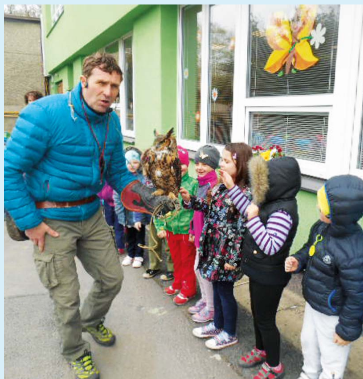
UKÁZKA. Odvážní se mohli dravců i dotknout.