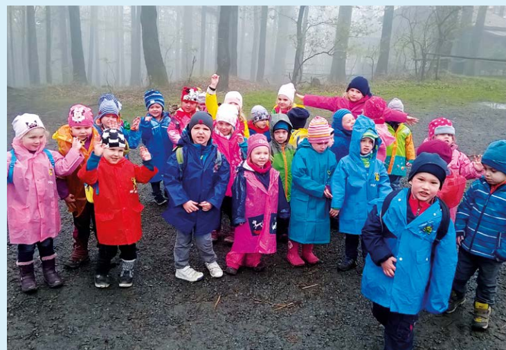
ZA DOBRODRUŽSTVÍM. Malé Zámostničky nic neodradí.