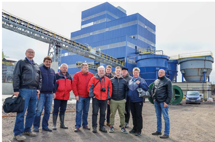
V HEŘMANICÍCH. Členové komise při prohlídce nové technologie 12. dubna.