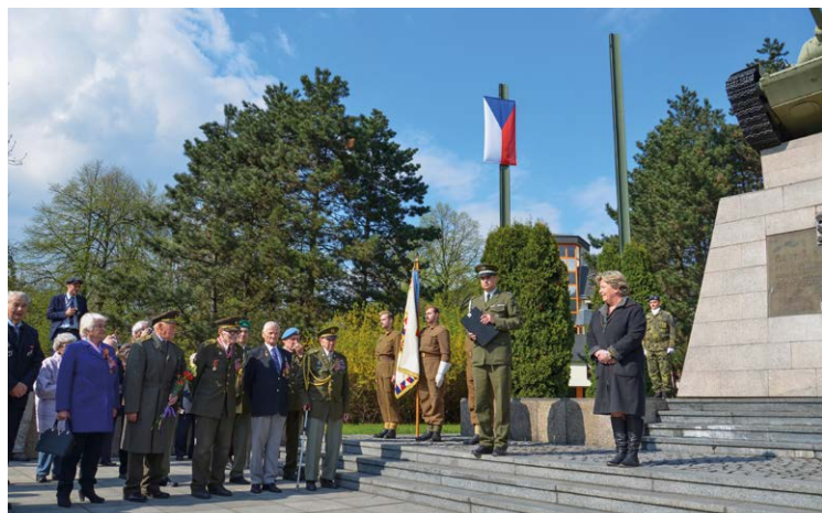
72. VÝROČÍ. Představitelé městského obvodu uctívají památku obětí 2. světové války.