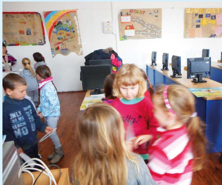
NÁVŠTEVA. Děti zjišťují, jak to vypadá v opravdové škole.