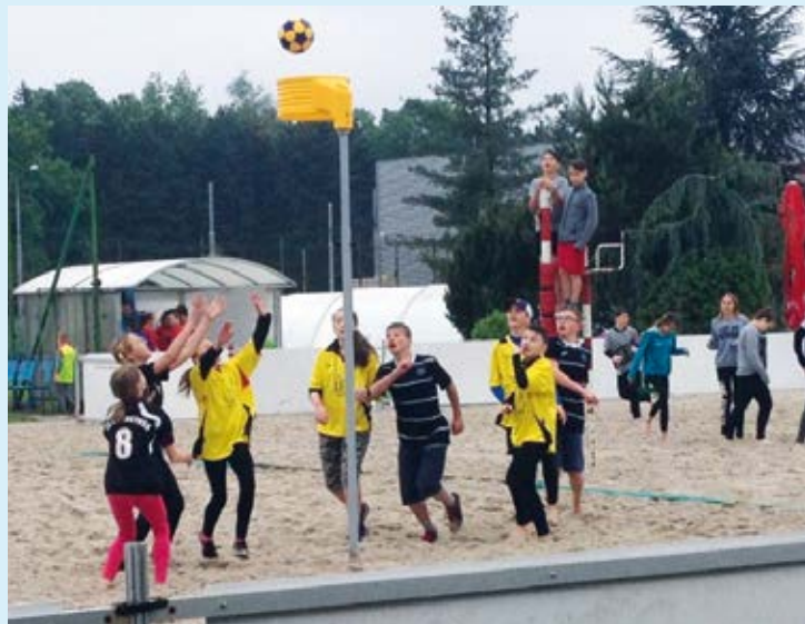
VÝBORNÉ VÝKONY. ZŠ Bohumínské se na turnaji dařilo.