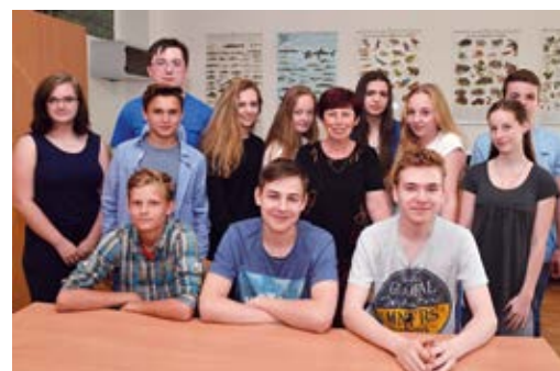
ZŠ BOHUMÍNSKÁ. Paní učitelka v práci.

Všem žákům přejí, aby si prázdnin užili co nejvíce, odpočinuli si a načerpali dostatek sil pro další školní rok.