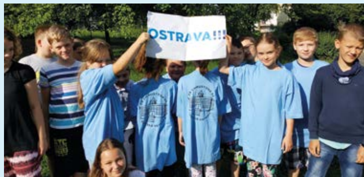
OSTRAVA!!! Oslava dne dětí na Landeku.