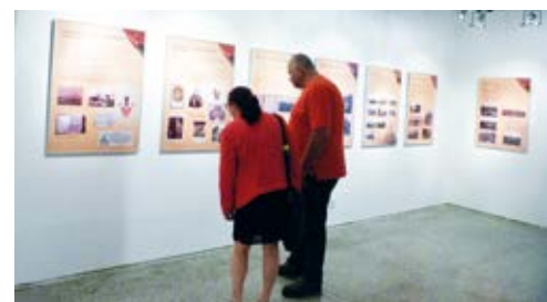
V GALERII. V sobotu 10.6. bylo otevřeno až do půlnoci.