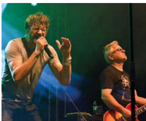
ROCK FEST. Dan Bárta i další interpreti bavili rockery všech generací.

Uvnitř hradu stála dvě pódia, na kterých se střídaly kapely až do půlnoci. Velkých ovací se dočkala především hlavní hvězda večera, zpěvák Dan Bárta se znovuobnovenou kapelou Alice, ovšem neméně se publiku líbila i domácí zavedená jména - Limetal, Salamandra nebo Doga.