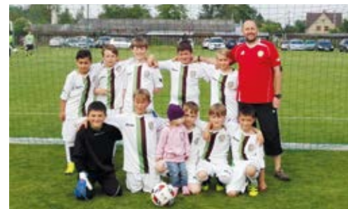
ÚSPĚCH. Heřmanice na prvním místě.