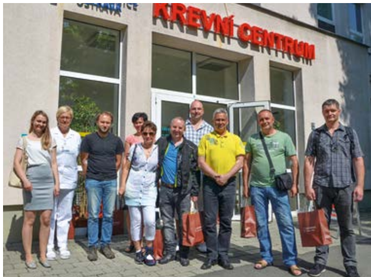
DÁRCI. Hromadný odběr krve.

Mimořádnou akci zorganizoval městský obvod Slezská Ostrava. Dne 30. května se setkali v Krevním centru Fakultní nemocnice Ostrava dobrovolníci, které slezskoostravská radnice vyzvala, aby se zapojili do hromadného odběru krve.