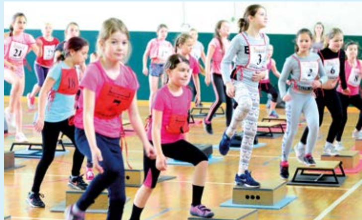
VÍTĚZSTVÍ. Žákyně ZŠ Bohumínská stanuly na stupních vítězů.