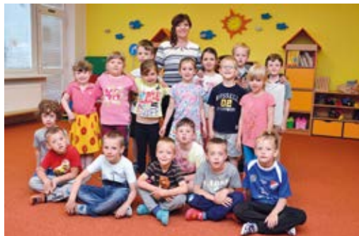
MŠ KOBLOV. Paní učitelka v práci.

Dětem přejí krásné a slunečné prázdniny, plné zajímavých zážitků a kolegům, aby si o prázdninách pořádně odpočinuli a s elánem vkročili do nového školního roku.