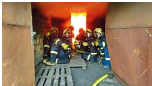
V AKCI. Heřmaničtí hasiči prováděli výcvik ve Vítkovicích a zkoušeli hašení v Hrušově.

Výcvik byl rozdělen na tři stanoviště. První stanoviště se týkalo hašení požáru v místnosti.