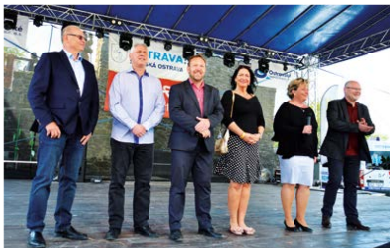
ZAHÁJENÍ. Vedení městského obvodu zdraví občany.

li první účinkující. Těmi letos byli žáci ZŠ Bohumínská. Celé dopoledne se střídala vystoupení mateřských i základních škol z celé Slezské Ostravy. Žákyně i žáci předváděli nejrůznější taneční kreace i akrobatická čísla, nechyběla spousta