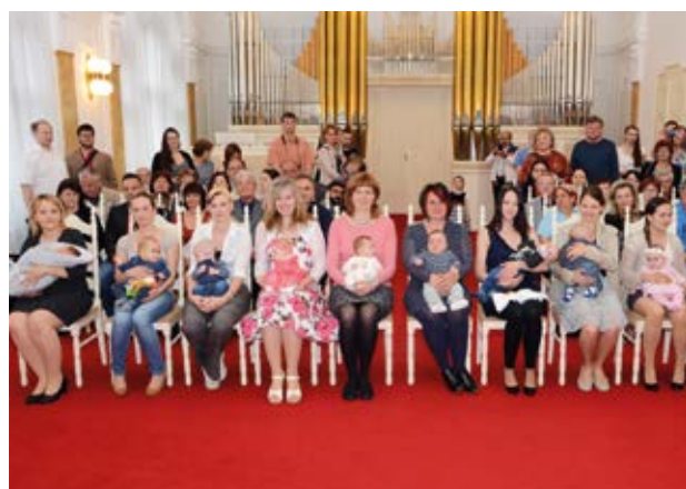
OBŘAD. Zaplněná síň slezskoostravské radnice.