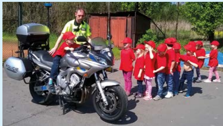
OPRAVDOVÁ MOTORKA. Zámostníčci v Nové Vsi.