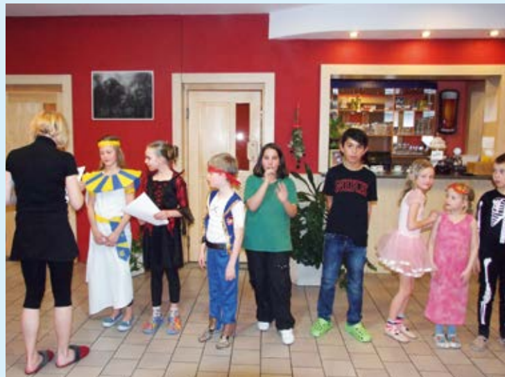
RALIŠKA. Děti odjely na týden do Beskyd.