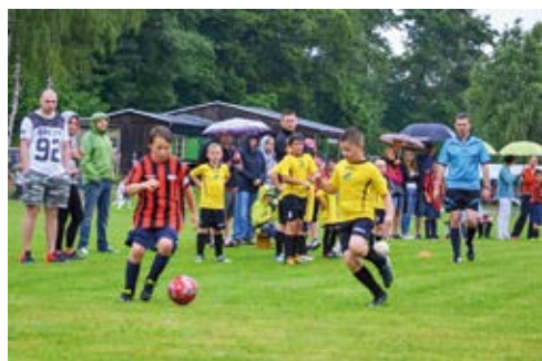
ZÁPAS. Domáci Koblov /ve žlutém/ v souboji s hostujícími Heřmanicemi.

Další v pořadí: TJ Lokomotiva Suchdol nad