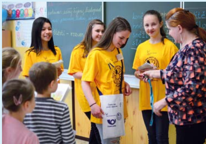
ŽLTÉ KVÍTKY I TRIKA Dobrovolníci ze ZŠ Bohumínská.