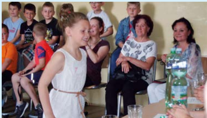
VE SPOLEČENSKÉM. Soutěž má přesná pravidla.