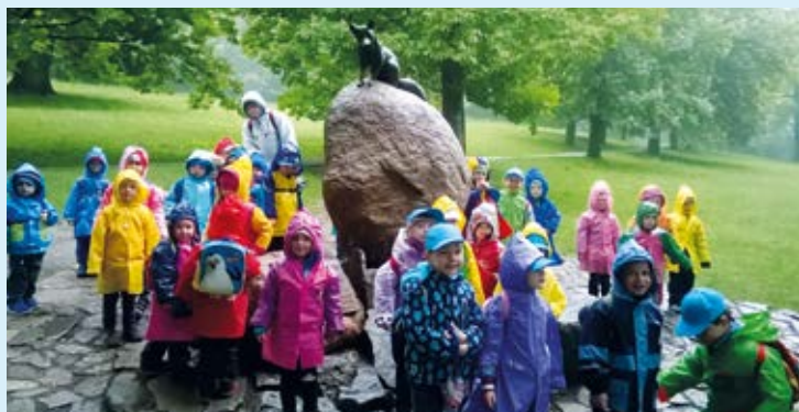
U BYSTROUŠKY. Počasí výletu moc nepřálo.