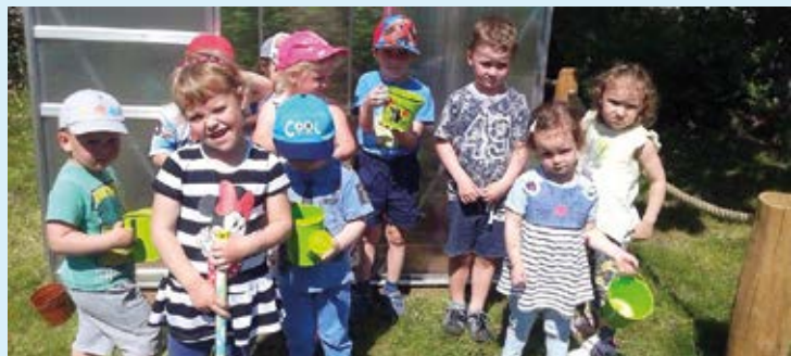
ZAHRAHA. Děti se učí naslouchat přírodě.