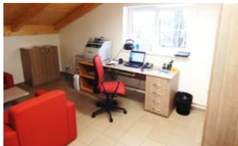
Kancelář Odborného sociálního poradenství.

Městský obvod Slezská Ostrava nabízí prostřednictvím oddělení sociálních služeb poskytování sociální služby Odborné sociální poradenství, a to ambulantní i terénní formou. Služba je zajišťována v objektu Nizkoprahového a poradenského centra na adrese Holvekova 204/44, Ostrava – Kunčičky.