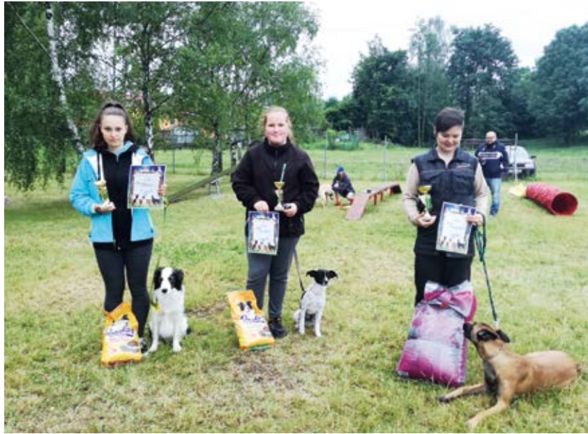
SOUTĚŽÍCÍ. Děti přivedly na Voříškiádku své věrné psy.

Akce pojmenovaná také jako Voříškiáda se konala 17. června, byla