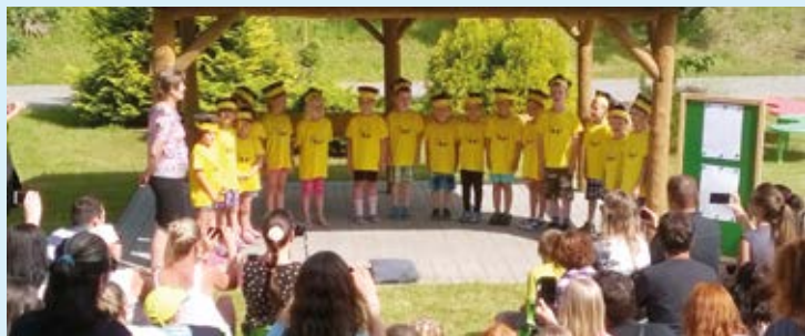
VČELÍČKY. Budoucí školáci v altánu.

sáhnout. Díky vstřícnému přístupu škol i města se tak úspěšně daří začleňovat i děti jiných národností, včetně dětí z početné komunity českých a slovenských Romů. A jak studijní cestu hodnotí sama ředitelka ostravské mateřské školy? „Celý systém vzdělávání v Bradfordu vnímám jako velice otevřený a přívětivý vůči rodičům a dětem bez ohledu na to, odkud pocházejí. Bylo pro mne velmi inspirativní vidět zapálené kolegy z Bradfordu, kteří společně věří jedné myšlence.“