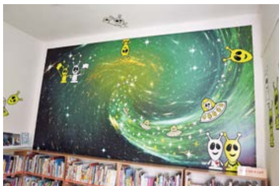
UFO! Hladňani našli nový domov ve zdejší knihovně.

Ukazuje se, že nejlepší místo je docela blízko: v knihovně. Nejlépe je jim mezi dětmi: učí se společně číst, poslouchají příběhy, listují knihami, poznávají bohatý svět lidí kolem sebe a vše zpracovávají do výtvarné či vyprávěné podoby. Z neznámých bytostí jsou Hladňani a Hladňánci.