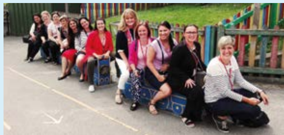
ÚČASTNICE. Pedagožky na zkušené v Anglii.

V červnu 2017 zorganizovala Nadace OSF pětidenní studijní cestu do anglického města Bradford. Jejím cílem bylo blíže se seznámit s tím, jak zde přistupují k předškolnímu vzdělávání a včasné péči. Na cestu se vypravilo dvanáct účastnic zabývajících se předškolním vzděláváním, včetně zástupkyně ministerstva školství, zástupkyně magistrátu města Ostravy, předsedkyně Asocia-