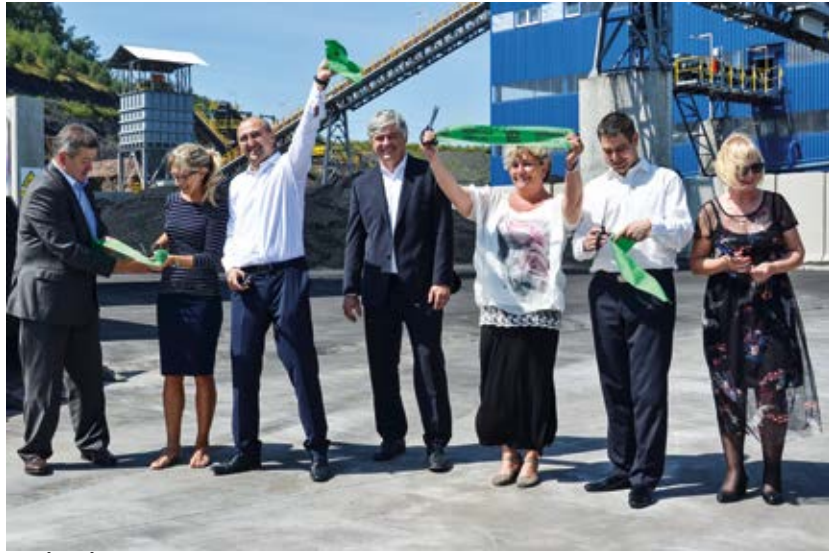
ZAHÁJENÍ. Slavností přestřižení pásky na heřmanické haldě.

Jedno z nejmodernějších úpravárenských zařízení v Evropě zpracovává těžební odpad na heřmanické haldě, která patří k největším ekologickým zátěžím kraje.