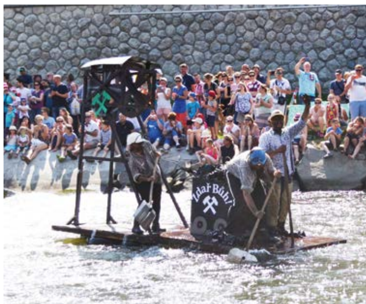
VÍTĚZOVÉ. Horníci na Ostravici.

Třetí ročník Rozmarných slavností Ostravice, které se konaly v sobotu 24. června, přivedl na oba břehy řeky tisíce návštěvníků. Akci společně připravily městské obvody Moravská Ostrava a Přívoz a Slezská Ostrava, za finanční podpory statutárního města Ostravy.