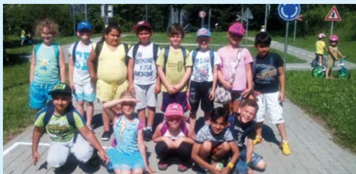
NA NÁVŠTĚVĚ. Děti ze ZŠ Pěší na hřišti mateřské školy.