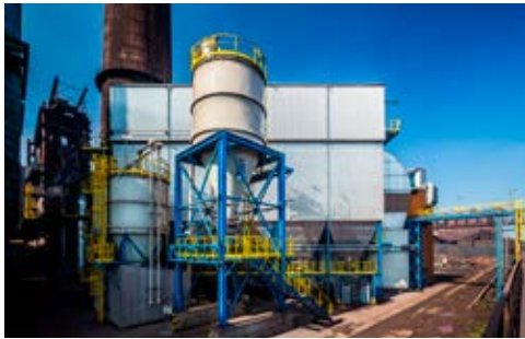
EKOLOGICKÝ PROJEKT. Odprašení spékacích pásů. Jižní část.

Výše zmíněných 13 odprašovacích technologií, které huť postavila nad rámec svých povinností, stlačily celkové roční komínové emise prachu na 440 tun, což není ani čtvrtinová hodnota