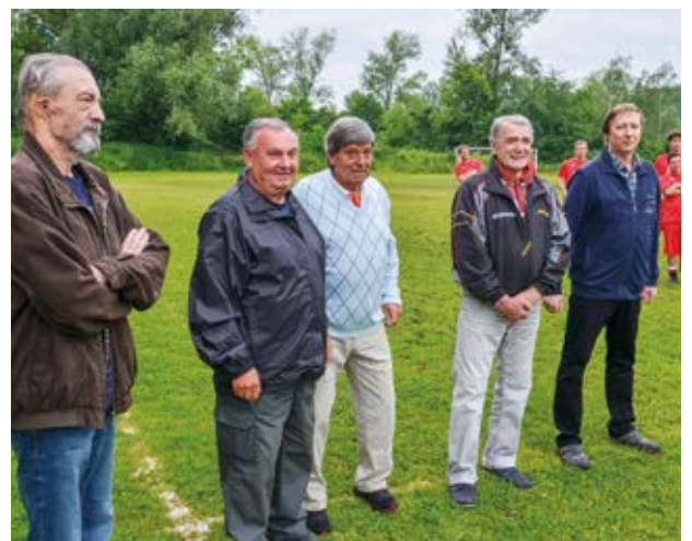
OCENĚNÍ. Pětice zaslužilých funkcionářů fotbalového klubu.