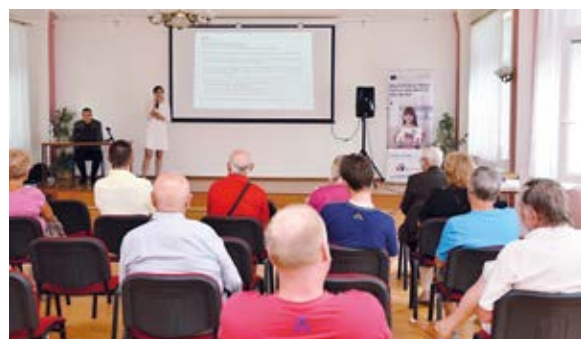
BESEDA. Odborníci radí občanům v KD Muglinov.