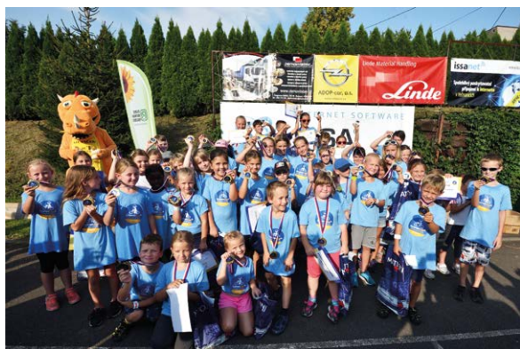
BIKEŘI. Na start dorazilo 93 odhodlaných závodníků.

Již po čtvrté byl konec prázdnin pro děti z Heřmanic a okolí veselejší než pro mnohé jejich vrstevníky. Pro všechny, kteří se přihlásili na cyklistický závod ISSANET CUP pořádaný spolkem Heřmanice dětem, čekal zajímavý závod, který vedl po asfaltu i po poli, do kopce i z kopce.