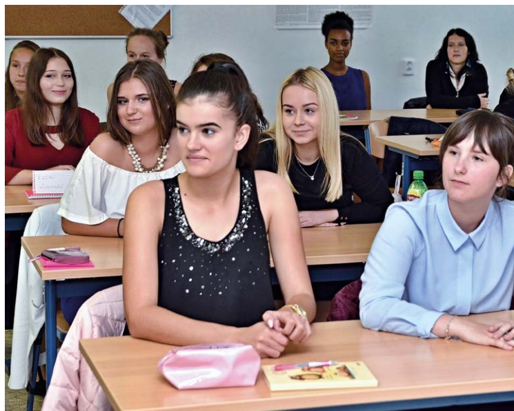
STUDUJÍCÍ. O školu je veliký zájem, nyní má celkem 112 studentů.