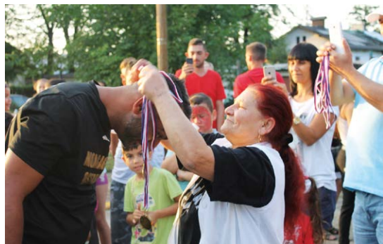
Paní Justýna předává medaile vítězům pátého ročníku Horizont cupu.

Komunita lidí žijící v Ostravě-Kunčičkách se opět semkla a uspořádala ve čtvrtek 24. srpna prostřednictvím Diecézní charity ostravsko-opavské fotbalový turnaj Horizont cup ve sportovním areálu TJ Ostrava Kunčičky. Turnaj, který se stal neodmyslitelnou součástí jejich veřejného života, navštívilo téměř 200 lidí.