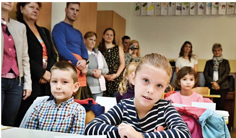
4. ZÁŘÍ 2017. Vítání prvňáčků v slezskoostravských školách.

„S úklidem jsme finišovali až do neděle 3. září. Chtěl bych i touto cestou poděkovat všem kolegům, kteří po celý týden včetně víkendu pomáhali školu připravit na start do nového roku,“ zdůraznil ředitel školy.