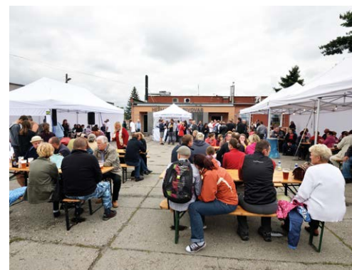
PRVNÍ. Lidé ochutnávali heřmanické pivo z výhradně českých surovin.