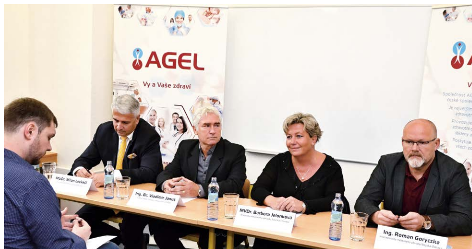
KONFERENCE. Vedení městského obvodu spolu s vedením společnosti Agel vysvětlují novinářům okolnosti vzniku nové školy.