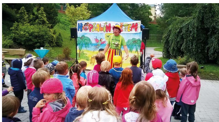
LEGRACE A SKOTAČENÍ. Školní rok začal zvesela.