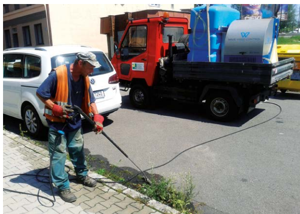
WAVE. Nová technologie hubí plevel.

V našem obvodě byly během léta již zbaveny plevely například ulice Fišerova, Stará Michálkovicová, Vrbická, K Návsí, Koněvova, Plechanovova či Bohumínská. Těšíme se z toho, že jsou procházky po obvodu příjemnější a plevel ubývá.