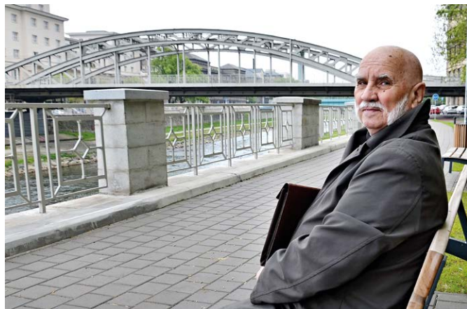
AUTOR. Česlav Piętoň, publicista a historik ze Slezské Ostravy.