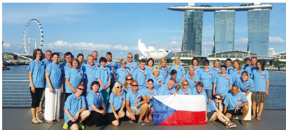
PĚVCI. Ostravské hlasy v jihovýchodní Asii.