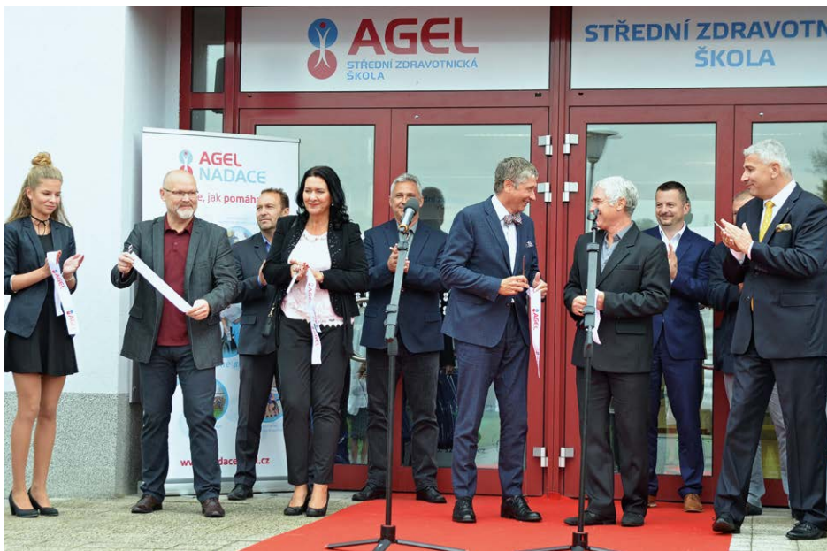
OTEVŘENÍ. Popřát hodně štěstí novým studentům přišli zástupci vedení Slezské Ostravy, společnosti Agel i Moravskoslezského kraje.

Společnost Agel oslovila s dotazem na volné prostory městské obvodů již v polovině roku 2016. I když tak měla v Ostravě více nabídek, nakonec Slezská Ostrava zvítězila. „Okamžitě jsme vycítili šanci, jak neobsazenou školu v Koblově opět zaplnit. Najít v dnešní době využití pro prázdnou školu vůbec není snadné. Vyvinuli jsme hodně velké úsilí, aby Agel zamířil zrovna k nám,“ popisuje vznik dohody mezi Agelem a městským obvodem místostarosta Goryczka, který byl u všech jednání od samého začátku až do zdárného konce.