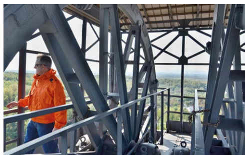
NA DŮL! Areál na Hladnovském kopci se poprvé otevřel veřejnosti.