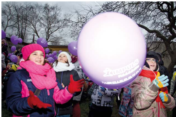
BALÓNKY, DÁRKY, OHŇOSTROJ I ELSA. Tak vypadala slavnost před muglínovským kulturním domem.

Vypouštění balonků s přáním Ježíškovi před muglínovským kulturním domem se stalo oslavou přicházejících Vánoc i nového roku.