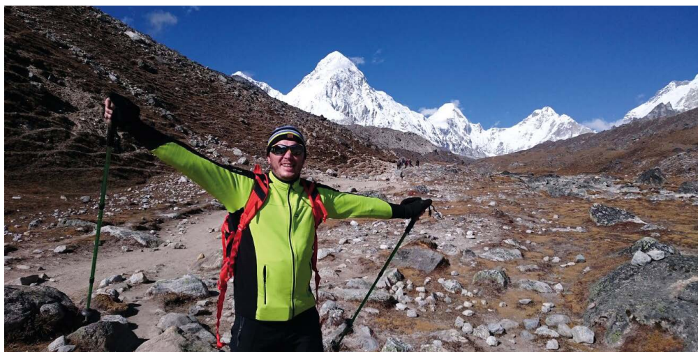
HORY. Každý z nás se dotkl dna.