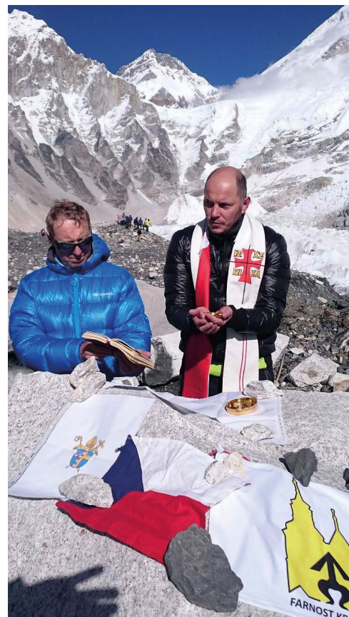
MŠE. Everest Base Camp, 5364m nad mořem.

centra, by byla na místě. V Kunčičkách to totiž žije.