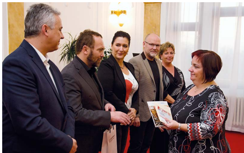
GRATULACE A PODĚKOVÁNÍ. Slavnostní akt v obřadní síni radnice.

„Za ocenění jsme moc vděčné, byla to krásná akce,