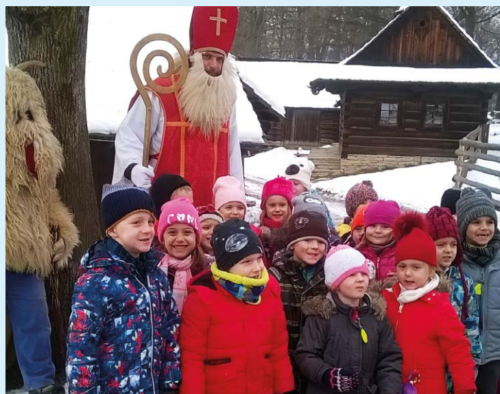
V ROŽNOVĚ. Zámostníčci vyrazili na výlet.