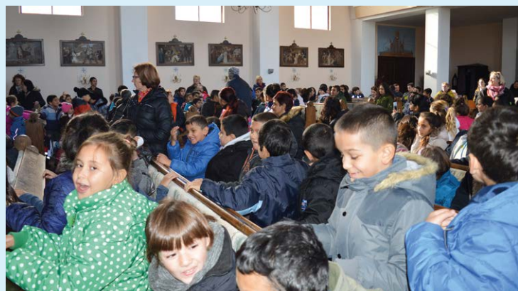
DUŠIČKY. Šest desítek dětí zaplnilo kostel.