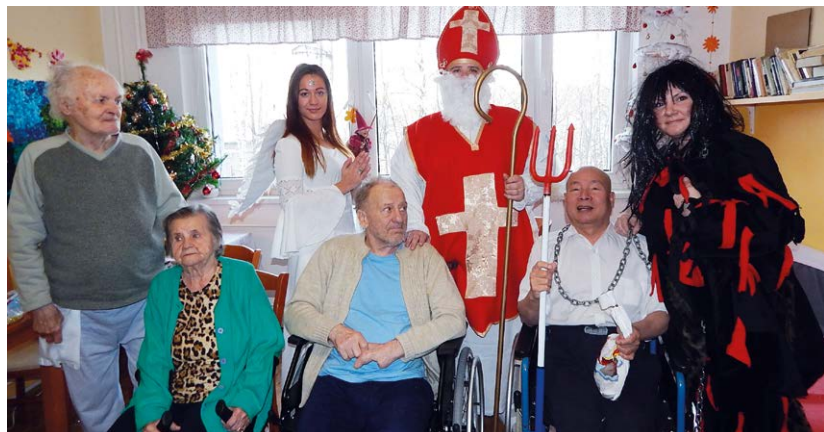
NAVŠTĚVA. Mikulášská nadílka na Hladnově.

V pondělí 5. 12. na oddělení odlehčovací pobytové služby v DPS Hladnovská 757/119a, Ostrava - Muglinov zavítal Mikuláš.