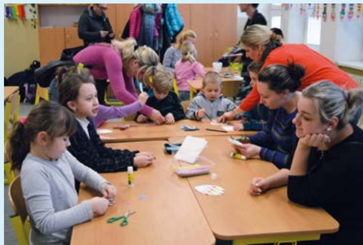
KUTILOVÉ. Příjemně prožité odpoledne.