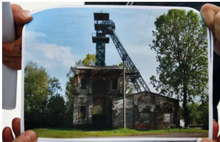
OPRAVENO. Stav budovy č. 1 před rekonstrukcí a po ní.