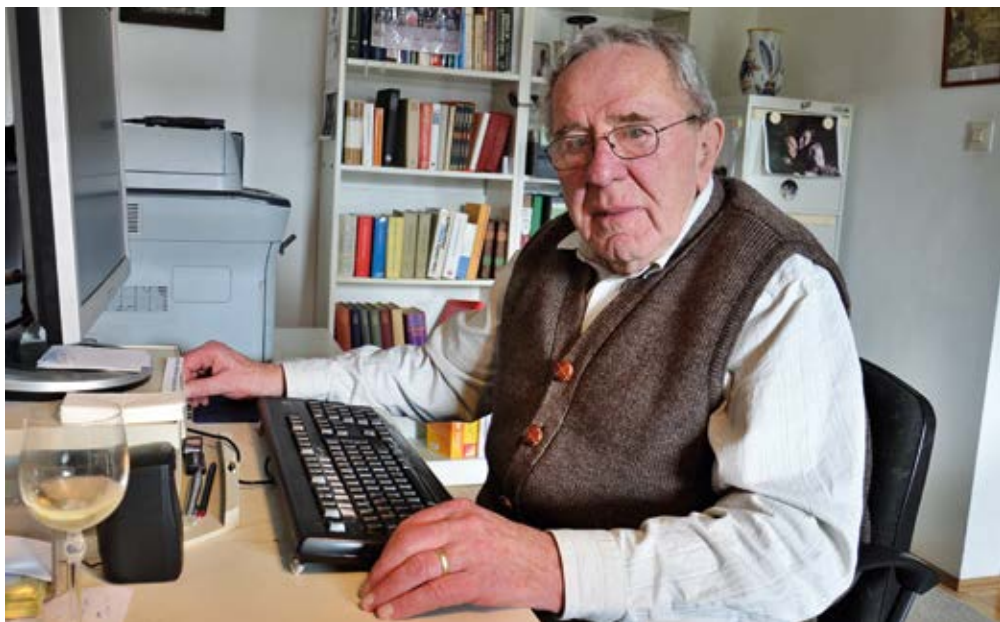
OTA FILIP. Autor ve své pracovně v německém Murnau nedaleko Mnichova.

Ota Filip odešel z Československa do německého exilu v roce 1974, předtím byl v roce 1970 odsouzen na 18 měsíců za podvrácení republiky. Stal se jedním z nejvydávanějších českých exilových spisovatelů, jeho díla vyšla v mnoha jazycích, obdržel