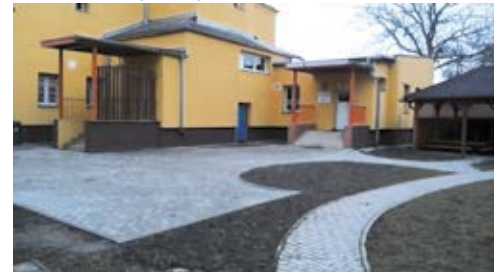
Zpevněné plochy u MŠ Frýdecká