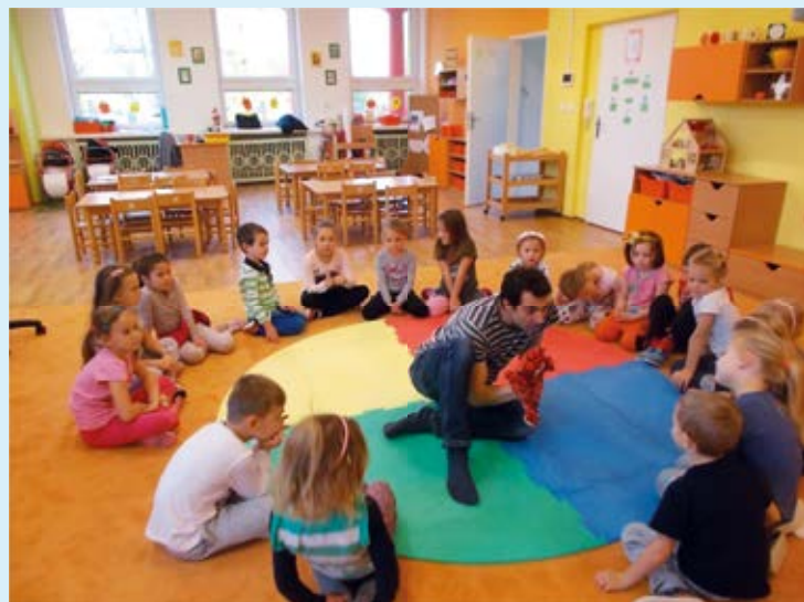
VÝUKA. Rodilý mluvčí v mateřské škole.