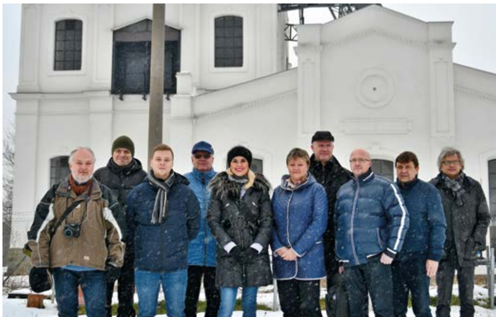
EXKURZE. Členové komise životního prostředí v Kunčičkách.

Zatímco budova č. 1 byla opravena do stavu, kdy těžba skončila, sousední budova č. 2 získala podobu z doby svého uvedení do provozu, tedy z roku 1901. Vše se dělo za dohledu a se souhlasem památkářů, kteří pokládají areál dolu za jeden z nejvýznamnějších na Ostravsku a Karvinsku. A to především právě díky jinde nezvyklé architektuře. Opravená budova č. 2 si pro svoji podobu vysloužila přezdívku hornické Versailles. Protože mnohé architektonické prvky se nezachovaly, museli obnovitelé budovy postupovat podle starých fotografií a jednotlivé věžičky, balustrády, schodiště