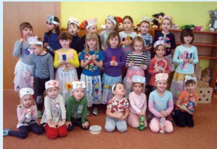
TANEC A RADOST. Děti se bavily v Koblově.