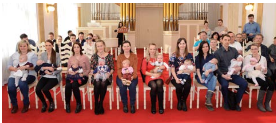
/red/ SLAVNOST. Děti a jejich rodiče.

Příští vítání dětí ve slezskoostravské radnici se uskuteční na začátku měsíce června.