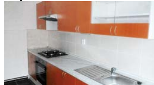
Rekonstrukce bytových jednotek