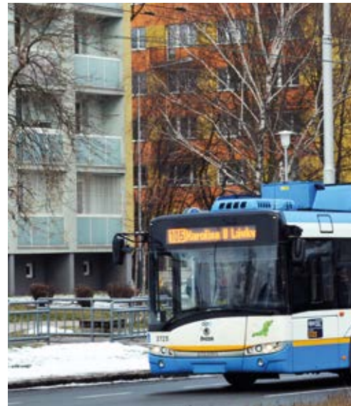
Ilustrační foto/ archiv

Experti na hromadnou dopravu vidí Slezskou Ostravu následovně: nízká hustota obyvatelstva, obrovské přepravní vzdálenosti, spousta hluchých míst. „Uvědomujeme si, že je Slezská Ostrava podfinancovaná a že je to nespravedlivé. Když se rozdělují peníze, hledí se vždy nejprve na počet obyvatel. Tak je to zavedeno i na ce-