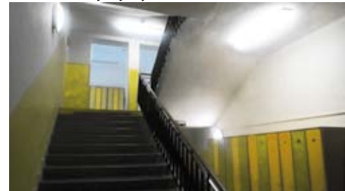
ZŠ Bohumínská po celkové rekonstrukci rozvodů elektřiny a vody