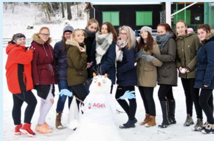
POMOC DĚTEM. Budoucí zdravotnice a jejich sněhulák.