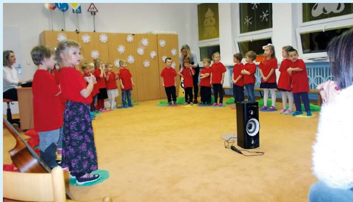
SNAŽÍ SE DĚTI. Vystoupení v plném proudu.