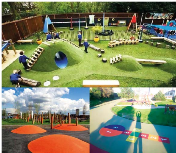
STUDIE. Architekti připravují nové podoby dětského hřiště a agility hřiště.