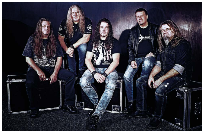
ARAKAIN. Jedna z hvězd blížícího se festivalu.

Pořadatelé pro letošní rok slibují známá jména tuzemské rockové scény. Vystoupí kapely jako Arakain, Traktor, Alkehol, Debustrol, Torr nebo domácí Kapriola, kterou tvoří výhradně rockerky.