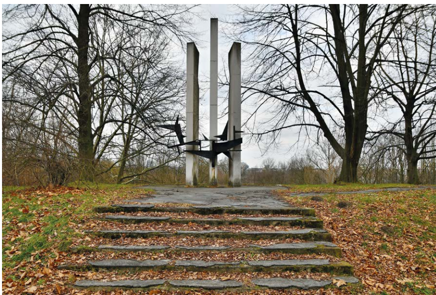
PŘED OPRAVOU. Pomník obětem hornické stávký 1894 na Těšínské ulici.

Dle sdělení společnosti Ostravské komunikace a.s. se budou realizovat také stavební práce spočívající v opravě vozovky na ulici Koněvova, které ovšem naruší i stávající chodníky. Z tohoto důvodu jsme požádali město Ostravu o poskytnutí finančního pokrytí opravy chodníků na této ulici. Potřebné finance však zatím nemáme přiděleny.