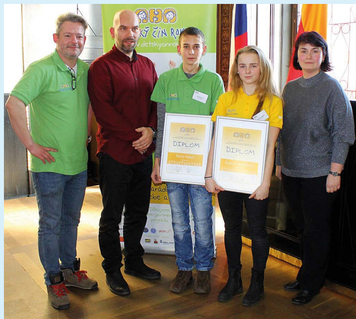
OCENĚNÍ. Úspěšní žáci ZŠ Bohumínská ve Staroměstské radnici.