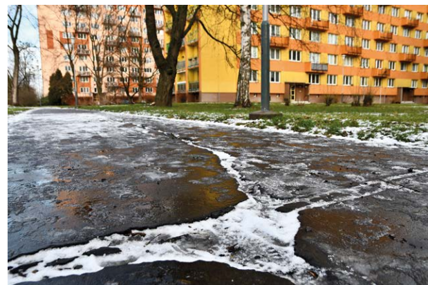
Chodníky ještě pamatují 70. léta.