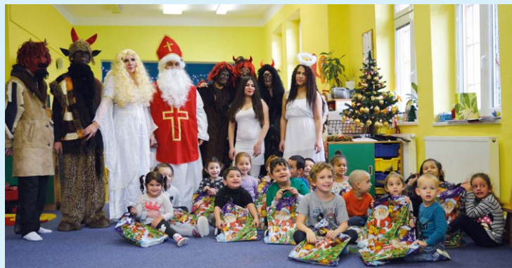
DEVĚTÁCI V ROLI. Výjimečný den v Kunčičkách.