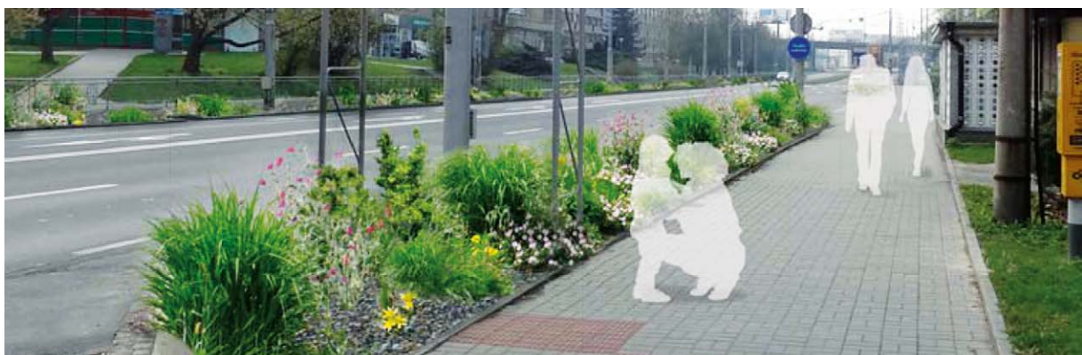
VIZUALIZACE. Součástí projektu jsou i květinové záhony na Bohumínské ulici.