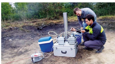
VÝZKUM. Experti zkoumají škodliviny na haldách.

Češi a Poláci se ke sledování starých hald spojili poprvé před více než čtyřmi lety, kdy v terénu i laboratořích prověřili více než 150 směsných