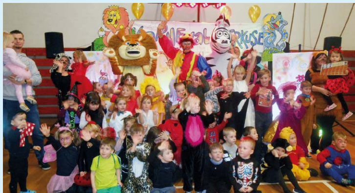
ZVÍŘÁTKA I POHÁDKOVÉ BYTOSTI. Děti se bavily v Koblově.