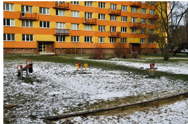
Hřiště čeká modernizace, přibudou hrací prvky.