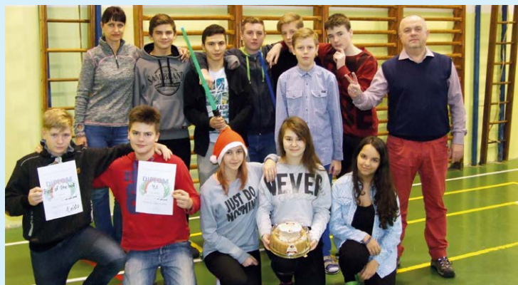
TURNAJ. Těsně před Vánoci se v tělocvičně konalo velké sportovní klání.