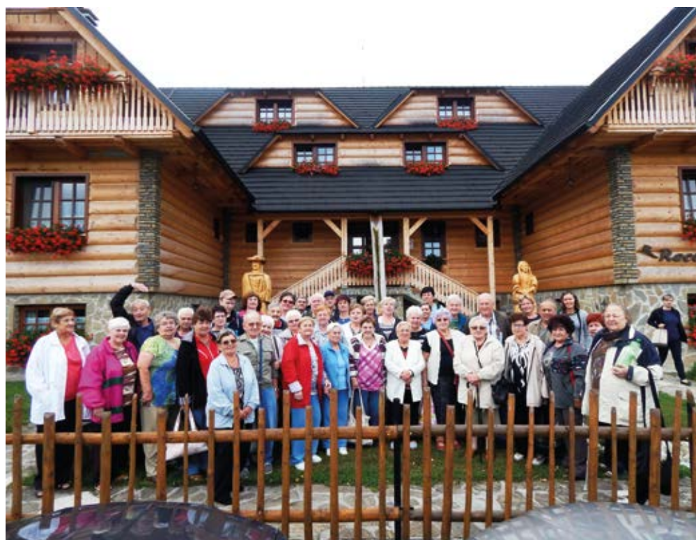
NA VÝLETĚ. Senioři Slezské Ostravy na organizovaném zájezdu na Slovensku.