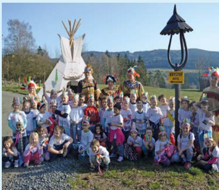
INDIÁNSKÝ KMEN. Dobrodružství v Beskydech.