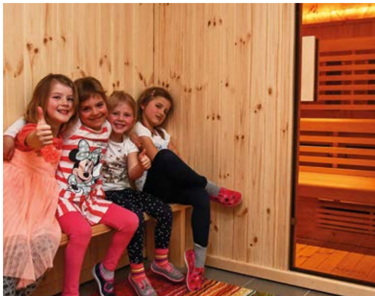
SUPER! Uživatelky infrasauny jsou s novým zařízením spokojeny.