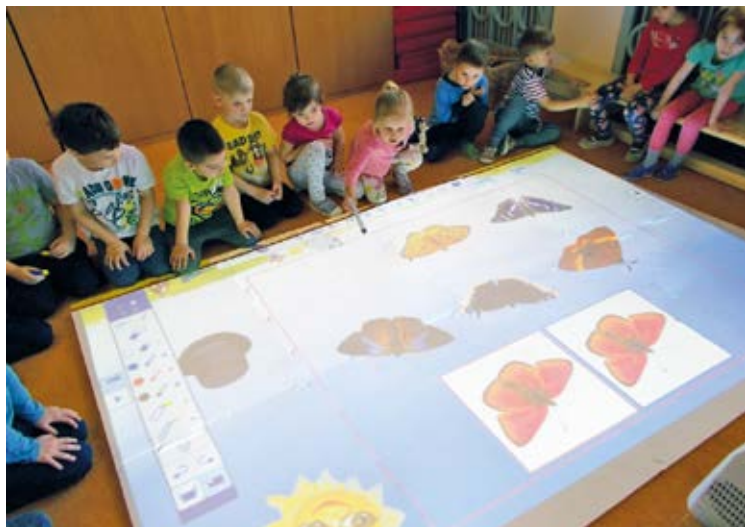
SWEETBOX. Moderní technologie v MŠ Zámostní.

Vzhledem k nedostatečnému signálu v mateřských školách městský obvod požádal o připojení všech budov mateřských škol na Metropolitan optickou síť města Ostravy, a Rada města Ostravy tento požadavek schválila, včetně navýšení rychlosti internetu pro základní školy. Nyní mohou ředitelé mateřských škol plně informační a komunikační techno-