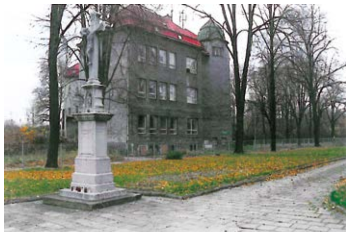
Kříž u kostela stojí už 120 let.

Po osvobození se začalo s budováním báňského průmyslu. Zvýšení těžby na dole Stalin I (bývalý důl Ida) a založení nového dolu Stalin II si vyžádalo novou výstavbu finských domků v lokalitě Liščina. Kromě dolů Stachanov (Hubert) a Stalin I (Ida) byl v 60. letech 20. století v provozu chemický závod Dukla (bývalá továrna na sodu), Hrušovská kamenina (bývalá továrna na hliněné zboží), Kovopodnik, vyrábějící TV antény pro celou republiku, Pozemní stavby zde měly sklad dřeva, Městský stavební podnik zase stolárnu, nescházela ani výroba limonád a zahradnictví. V rámci služeb zde byly obchody přes