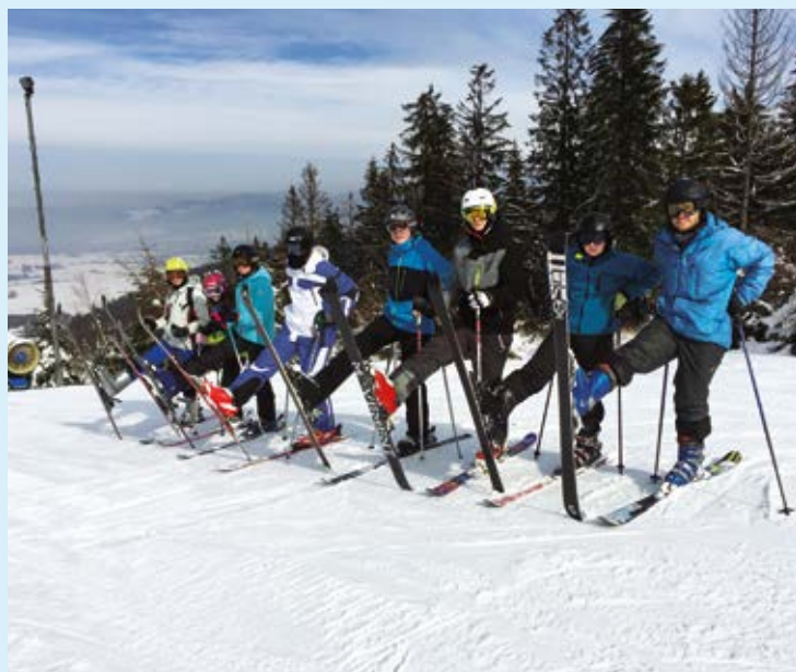
KURZ. Na lyžaře čekala pohádková zima plná sněhu.