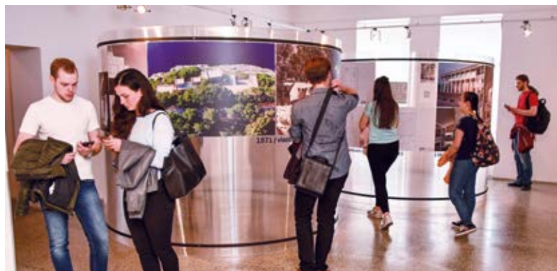
VERNISÁŽ. Pocta Jørnu Utzonovi.