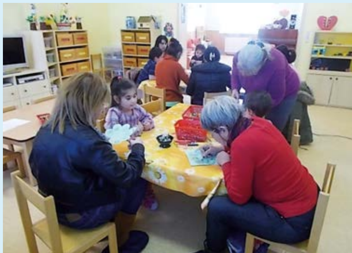
VYDAŘENÉ SETKÁNÍ. Tvořila celá mateřská škola.

Za kolektiv MŠ Keramická vedoucí učitelka Čalová