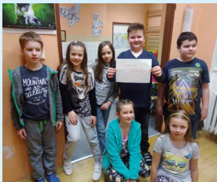
ČTENÁŘSKÁ NOC. Děti měly na programu Čapka, Foglara i Andersena.