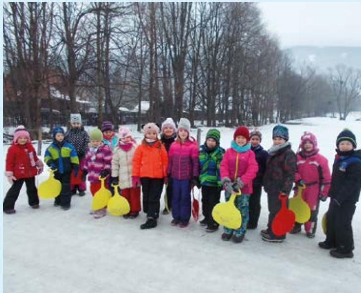
DĚTI A LOPATY. Výlet za čerstvým vzduchem.