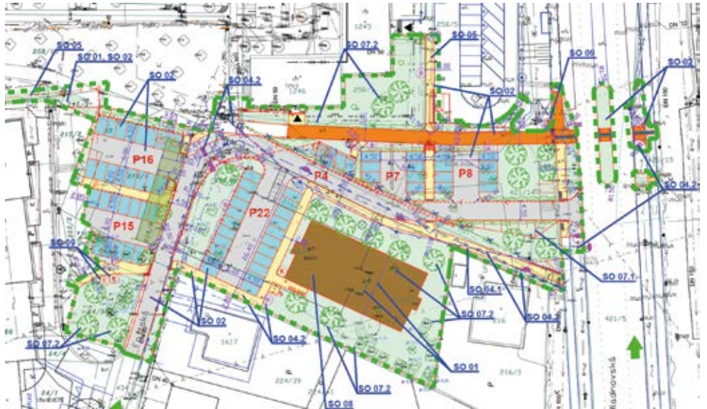
Regenerace sídliště Muglinov 5. etapa - koordinační situace stavby

Fojtská a Želazného. Součástí etapy je vybudování nového sportovního hřiště, kde bude možno provozovat sporty jako tenis, fotbal, volejbal, nohejbal nebo basketbal. Hřiště bude oploceno ve výšce 4 – 6 metrů. Dále bude zřízeno nebo zrekonstruováno více než 70 parkovacích míst, opraveny chodníky a silnice, dojde k instalaci nových laviček, stojanů na kolo, košů na psí exkrementy a košů na odpadky. Značné usnadnění pro občany nastane po provedení plánovaného propojení ulic Želazného a Hladnovská. Všechny tyto úpravy si vyžadují provést v některých místech nezbytné kácení stromů, věřím však, že výsledný efekt modernizace bude mnohem pozitivnější. V rámci 5. etapy dojde také k výsadbě více než 20 stromů, množství keřů a zasetí trávy.