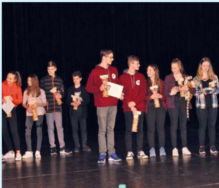
VÍTĚZOVÉ. Žáci z Bohumínské si odvezli prvenství.