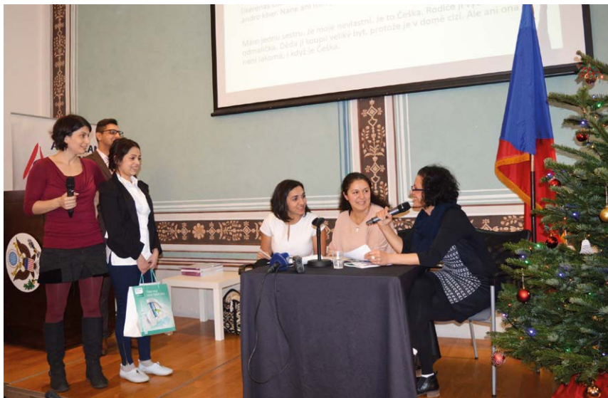
PRVNÍ CENA. Nejlepší žáčky uspěly jazykově čistou a plynulou romštinou.

V druhé kategorii mluveného slova vybírala odborná porota z 28 zasláných videí. Právě v této kategorii naše tři ostravské dívky 9. ročníku ZŠ doslova dojalý porotu svou jazykově čistou a plynulou romštinou. Právem si tak odvezly první místo v této kategorii.