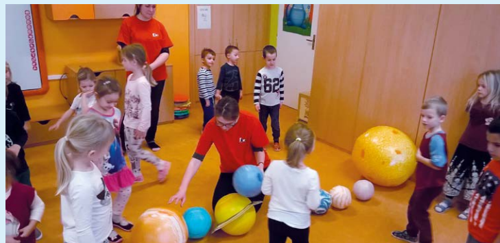
NAŠE PLANETA. Zámostníčci zkoumali fungování vesmíru.

Země jako míč, tak se jmenuje jedno téma z projektu Už vím proč, který se snaží dětem hravou formou objasnit život na naší planetě Zemi. A právě v rámci tohoto projektu přijeli ve středu 22. listopadu do naší MŠ odborníci se vzdělávacím programem Naše planety. Děti se dozvěděly, jak vznikl na Zemi život, a prohlédly si obrázky prvních živočichů. Nejvíce děti zaujali samozřejmě dinosauři, a zvířata, která na Zemi žijí nyní.