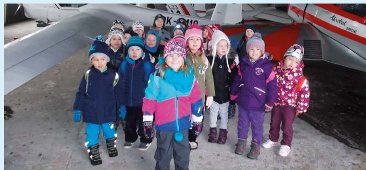
NA LETIŠTI. Malí Zámostníčci mezi letouny.

A do třetice projekt Už vím proč pomohl Zámostníčkům vydat se až do Frýdlantu nad Ostravicí. Společně s dětmi MŠ Antošovicá se vypravili dne 14. listopadu na exkurzi na místní letiště. Děti nahlédly do dvou hangárů, kde se dozvěděly mnohé z historie letiště a také ze současného provozu. Seznámily se s druhy letadel a měly možnost nahlédnout do kabiny a zažít tak skutečný pocit pilota a parašutisty.