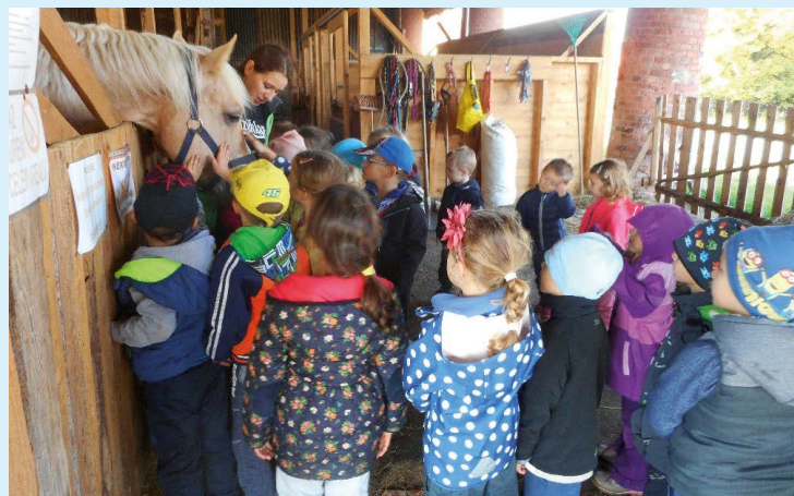
STUDÉNKA. Děti vyrazily za přírodou.