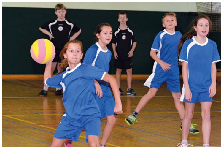
STARTUJÍCÍ. Účastníci turnaje v tělocvičně ZŠ Bohumínská.