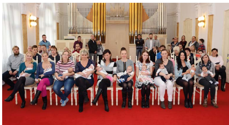
NEJMENŠÍ. Noví občánky v obřadní síni slezskoostravské radnice.