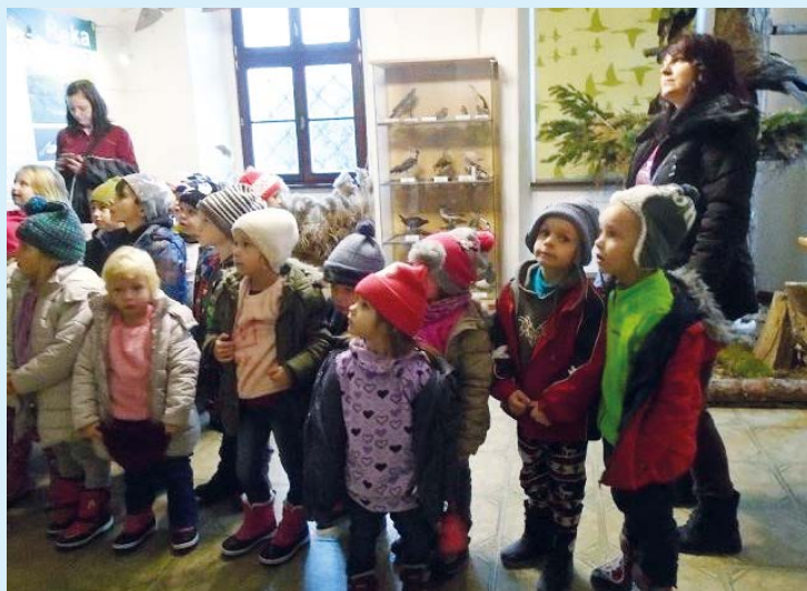
NA PROHLÍDCE. Jak se chovat k zvířatům?