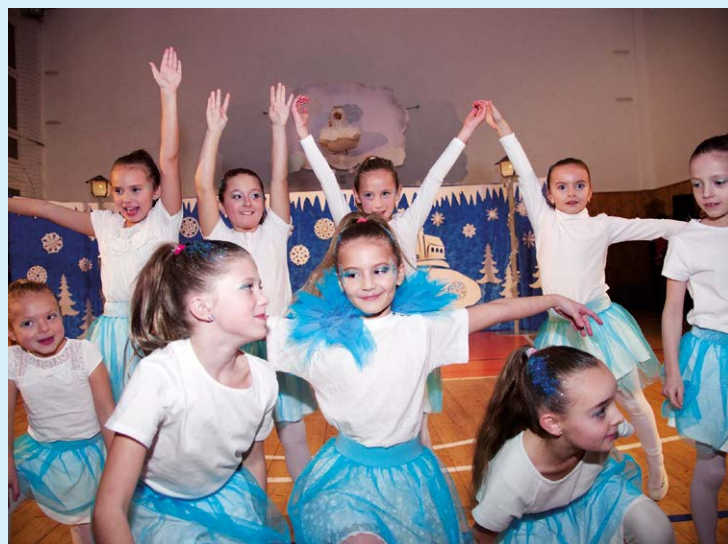
MILÁ TRADICE. Před Vánoci žáci recitovali, tančili, zpívali...