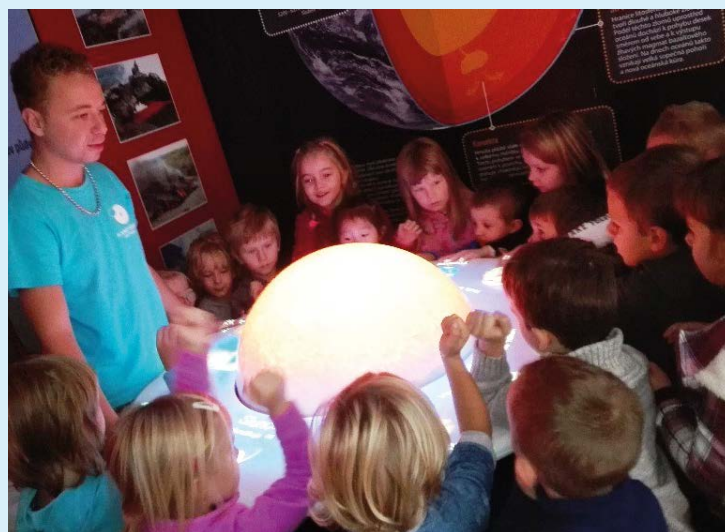
V PLANETÁRIU. Poznávání přírodních zákonů a dějů.