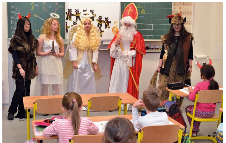
MIKULÁŠ S DRUŽINOU. Všechny děti byly hodné, dostaly dárky a mohly také hladit zlatá křídla a vlasy andělů.

Nejodvážnější holky a kluci z mateřských škol si dokonce mohli sáhnout na čertovo kopyto, méně odvážní se dotkli alespoň Mikulášovy