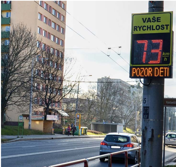
73 KILOMETROVÁ RYCHLOST U ŠKOLY. Časté překračování povolené rychlosti na Bohumínské ulici.

Uvažujeme také o instalaci zpomalovacích semaforů, které již fungují v některých obcích. Jednoduše řečeno, řidiči, kteří jedou v místě rychleji, než je povoleno, si díky těmto semaforům sami zapínají červenou.