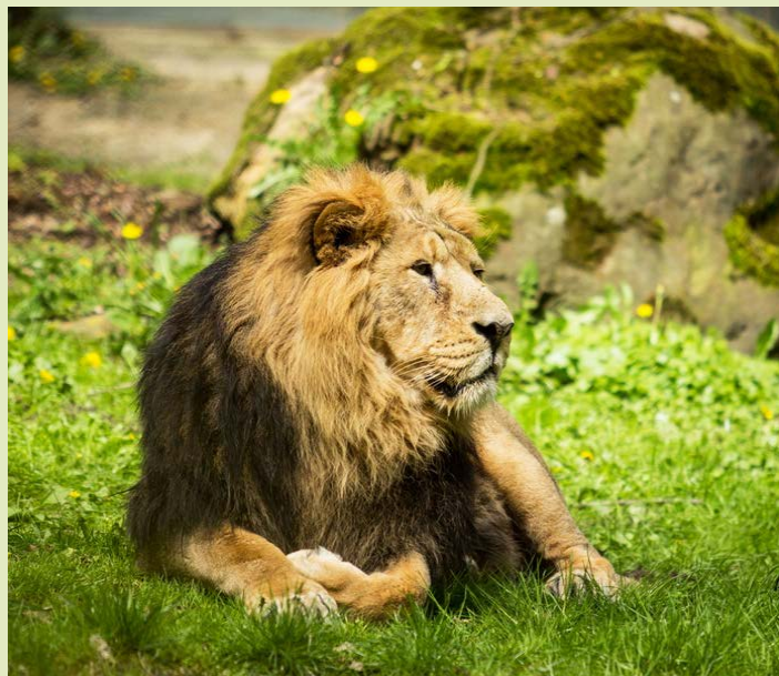
NÁVRAT. Samec lva indického se vrátí z Prahy.

i další naše druhy sov, například sýc rousný nebo kulíšek nejmenší,“ upřesňuje Nováková. Nedaleko sovích voliér byla zahájena i stavba další velké voliery pro dravce – pro ohrožené orly královské, jedny z našich největších dravých ptáků.