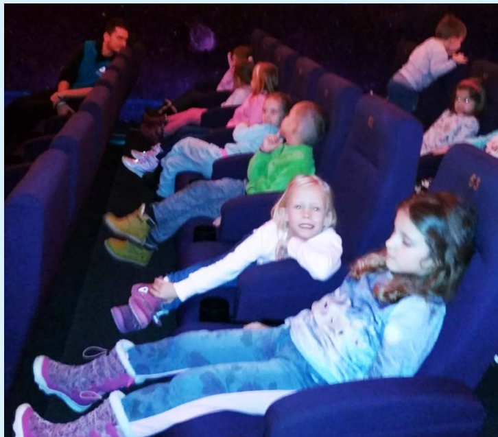
PROHLÍDKA TAJUPLNÝCH MÍST. Děti ze Slezské v planetáriu v Krásném Poli.