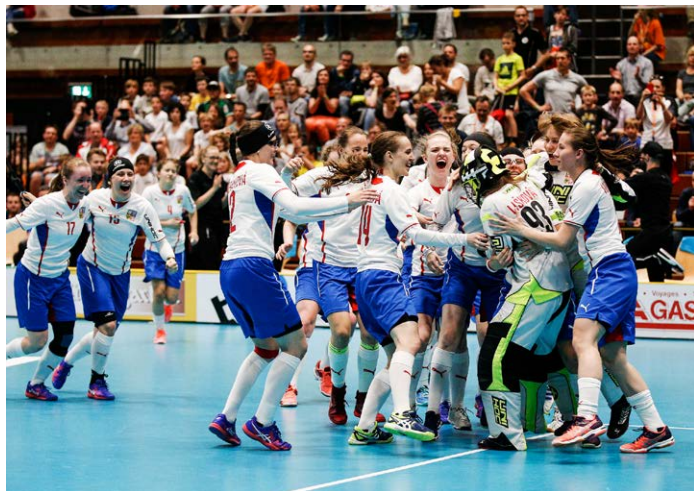
BRONZ! Juniorská reprezentace slaví zisk medaile na mistrovství světa ve Švýcarsku.

Když jsem si branku nakonec přece jenom zkusila, už jsem v ní i zůstala. Ale pozor, ne natrvalo. Dodnes to střídám. Když hrajeme dva zápasy po sobě, pak jeden hraju v poli a druhý chytám v brance.