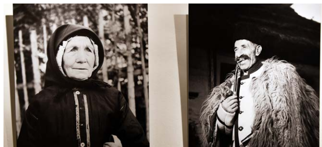
ŽIVOT V TATRÁCH. Fotografie byly pořízeny v 50. a 60. letech minulého století.