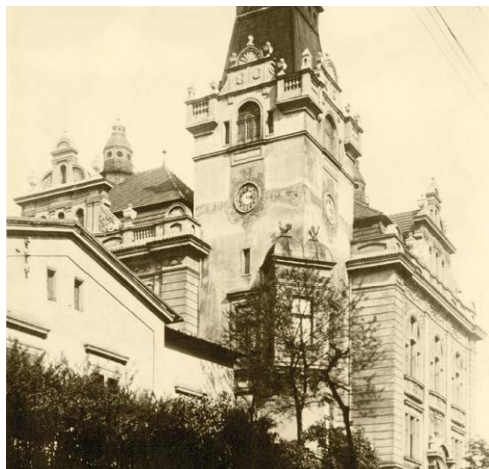
HLEDÁME FOTOGRAFIE. Městský obvod hodlá uspořádat výstavu z historických snímků Slezské.