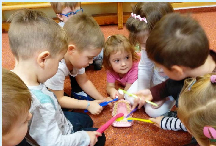
UMĚLÝ CHRUP. Děti zkoušely čištění.