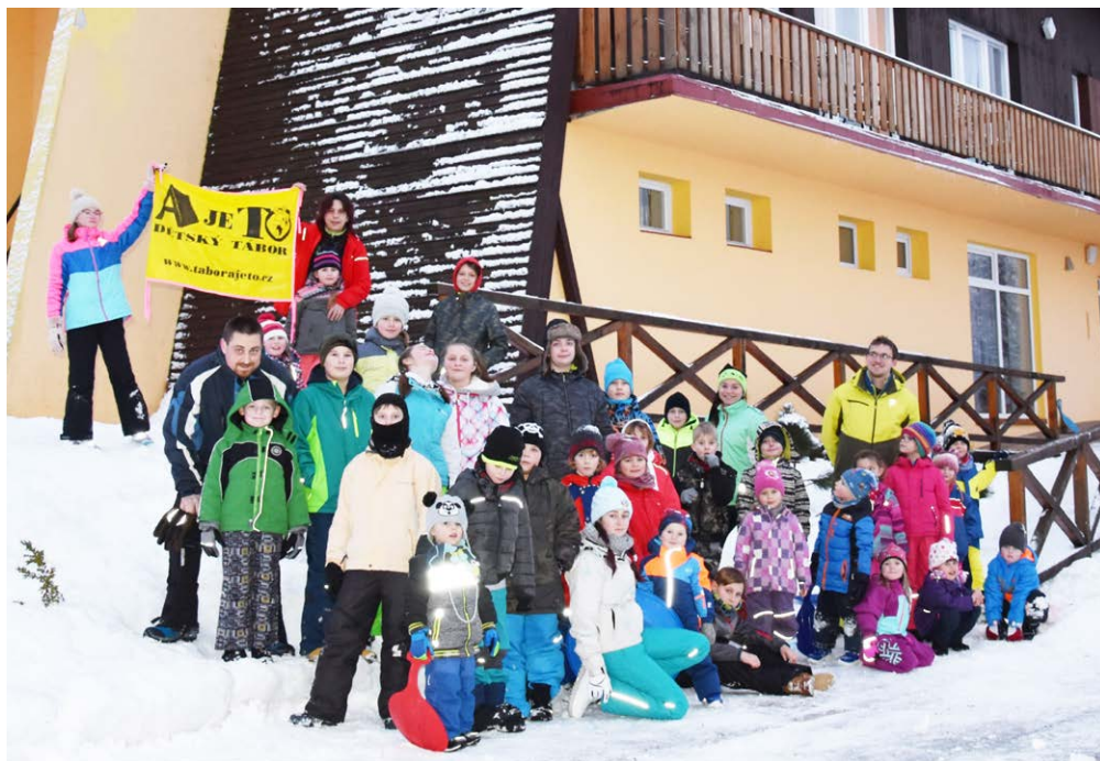
PRÁZDNINY! Děti z dětského tábora ze Slezské Ostravy vyrazily do Beskyd.

Bc. Silvie Šeděnková SDH Ostrava-Heřmanice