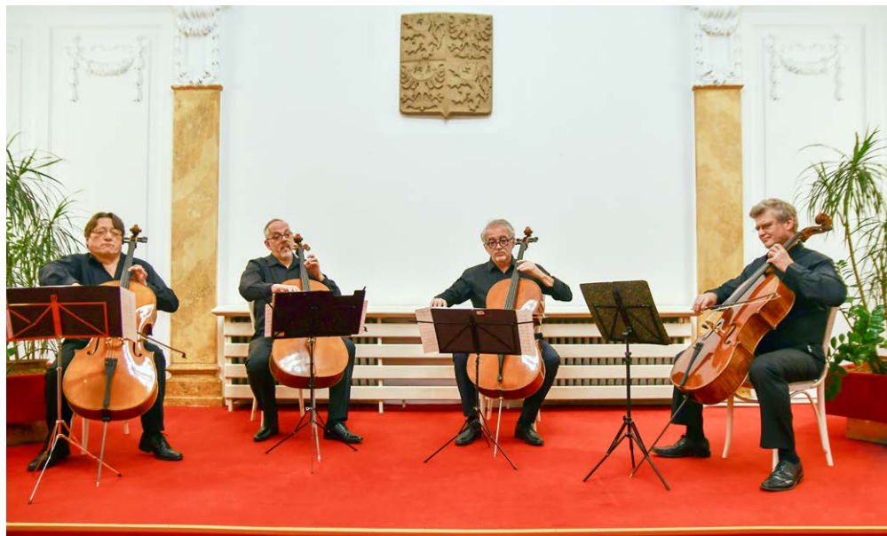
KONCERT. Čtveřice violoncellistů vystoupila před zaplněným sálem slezskoostravské radnice.