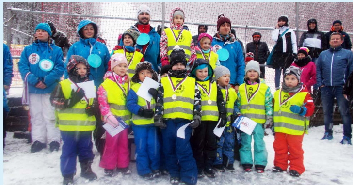
NA LYŽÍCH. Kurz v Palkovicích se konal od 14. do 18. ledna.

Za kolektiv MŠ Zámostní Bc. Kamila Čajková