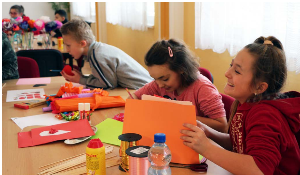
SRDCE A JINÁ TVOŘENÍ. Děti při výrobě dárečků v muglinovském kulturním domě.