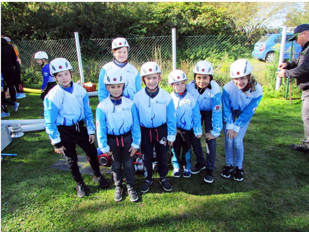
NEJMladší z hasičů. Členové skupiny v Kunčičkách.

Na pravidelných schůzkách nacvičují soustředěnou disciplínu, práci s hasičskou technikou a připravují se na jarní část soutěže. Při svých návštěvách jiných hasičských stanic se seznamují s prací svých dospělých dobrovolných i profesionálních kolegů. SDH Kunčičky připravily pro své členy také různé akce, mezi něž patřily: opékání párků, výlet do města Jeseník, návštěva hasič-