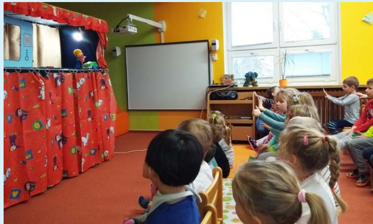
DIVADLO. Děti se v mateřské škole nenudily.