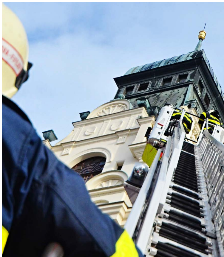
V AKCI. Budova slezskoostravské radnice v obležení hasičů.