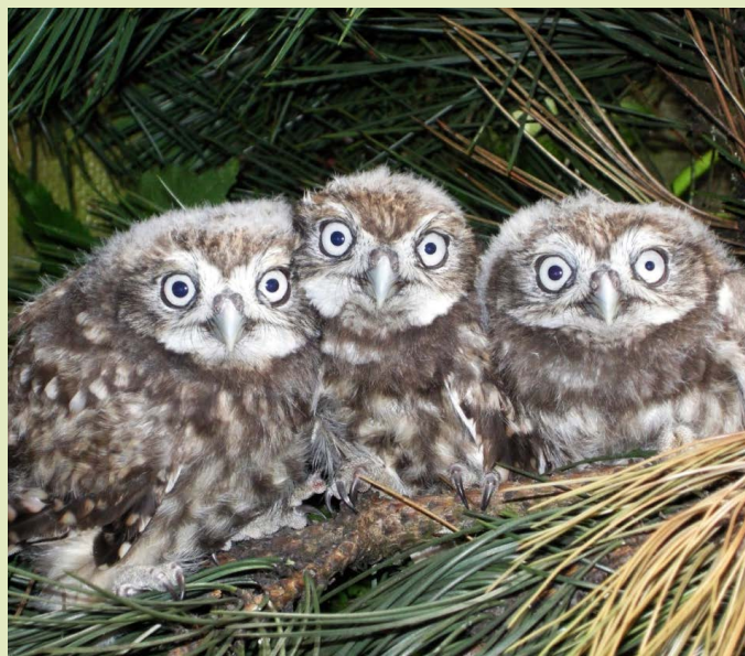
MLADÍ SÝČCI. Brzy v nových voliérách.

patriačních projektů pro sýčky obecné a sovy pálené – odchovaná mláďata bezplatně poskytuje pro vypouštění do přírody Česka i Slovenska. U puštica bělavého pak v Ostravě odchovávaná mláďata posilují divokou populaci těchto velkých sov v Rakousku v rámci mezinárodního záchranného a repatriačního projektu. „Sýčky a sovy pálené byli dosud chováni v zázemí, nově tak budeme moci představit tyto sovy i našim návštěvníkům. Ale nejen je, v nových voliérách najdou svůj domov