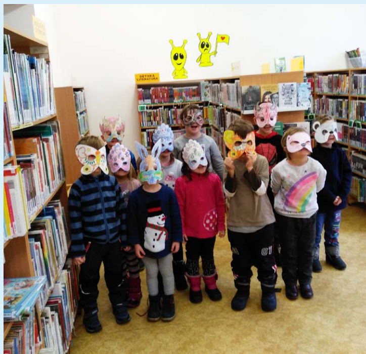
MEZI KNIHAMÍ. Pravidelně do knihovny.