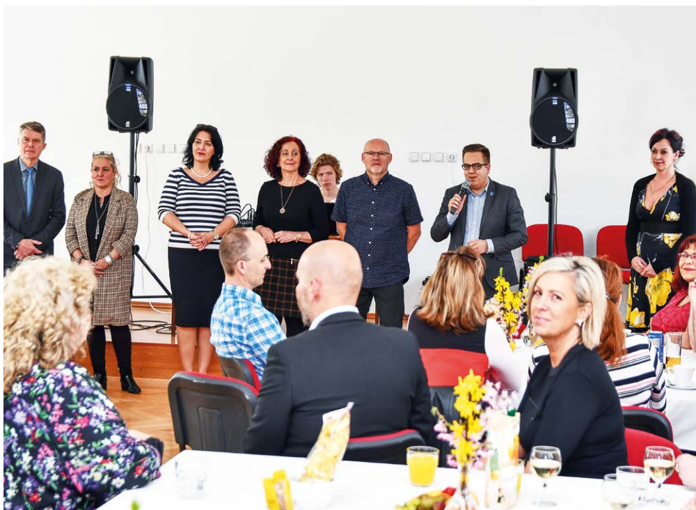
/red/ PODĚKOVÁNÍ. V rámci Dne učitelů byli slezskoostravští pedagogové pozváni do KD Muglinov.

Vedení obvodu rovněž v rámci Dne učitelů, který se slaví každý rok 28. března, poděkovalo za práci ředitelům slezskoostravských škol na individuálním setkání. Kromě pohoštění byly pro pedagogy připraveny v muglinovském kulturním domě i speciální pamětní hrníčky s nápisem Den učitelů 2019.