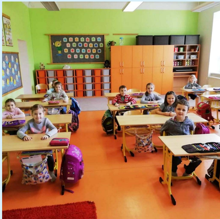
Z MATEŘSKÉ DO ZÁKLADNÍ. Motýlci vyrazili na návštěvu.