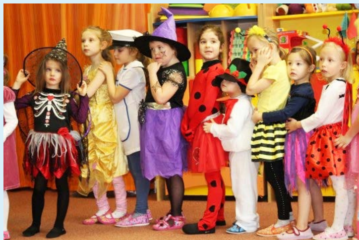
BÁJEČNÁ NÁLADA. Program plesu byl bohatý, plný soutěží, tanců a kouzel.