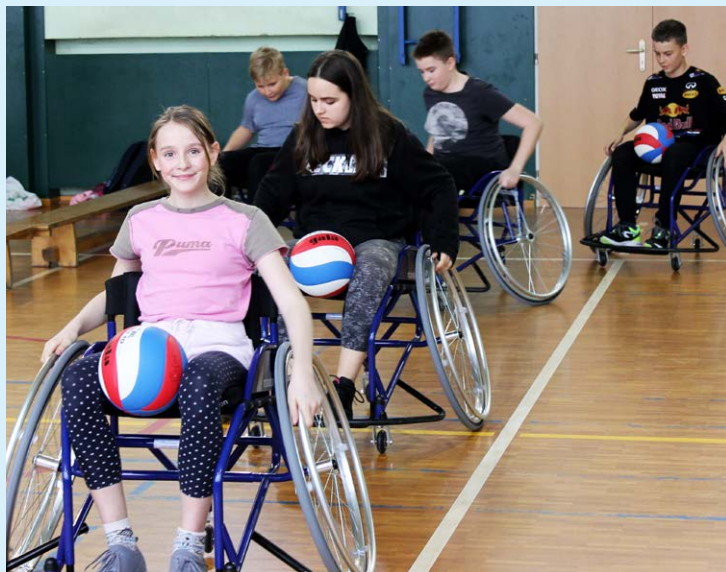
BASKETBAL NA VOZÍČKU. Para sport ve školní tělocvičně.