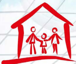
Rodinné a komunitní centrum Chaloupka Ostrava