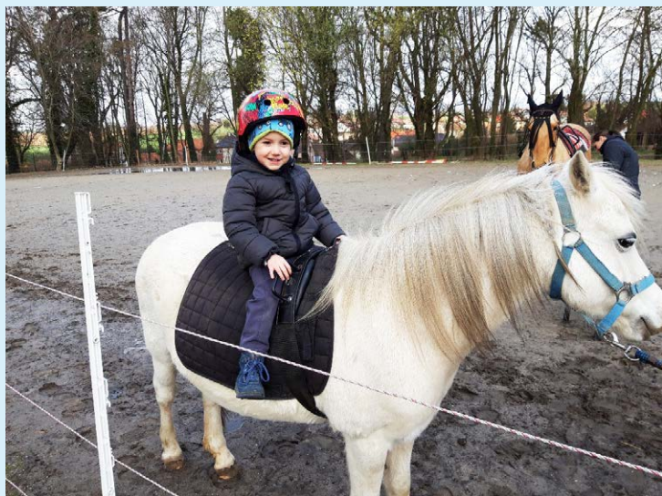
JAROŠŮV STATEK. Děti zkoumaly svět z koňského hřbetu.