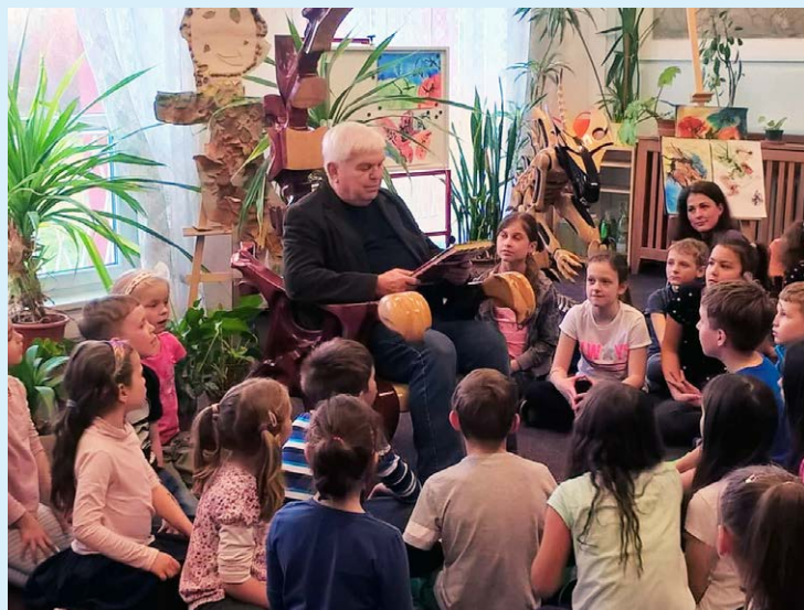
STANISLAV ŠÁRSKÝ. Známý ostravský herec četl dětem pohádky.