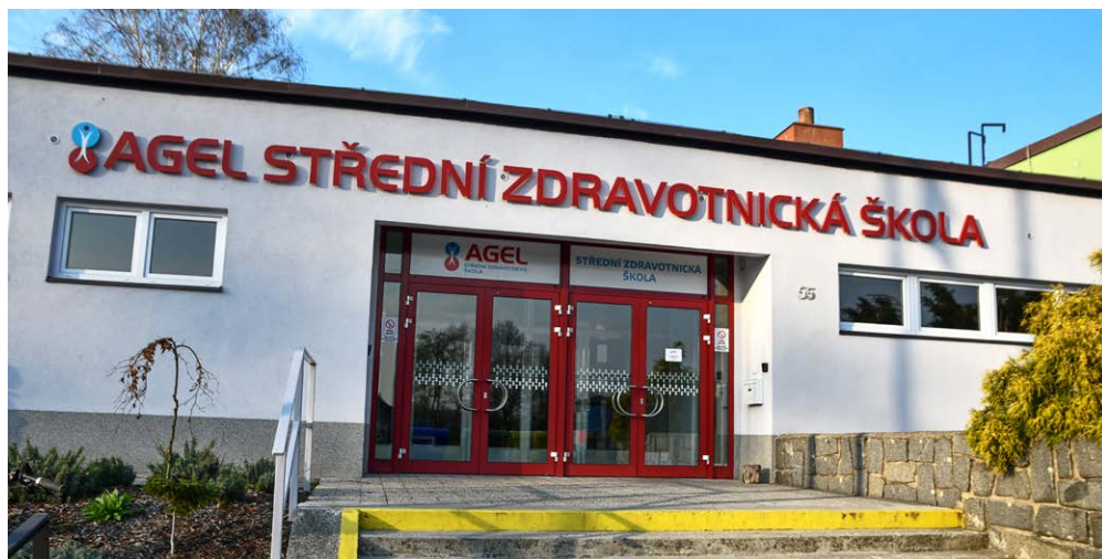
ŠKOLA V KOBLOVĚ. Skupina AGEL provozuje školu v Koblově v budově, kterou si pronajímá od městského obvodu.