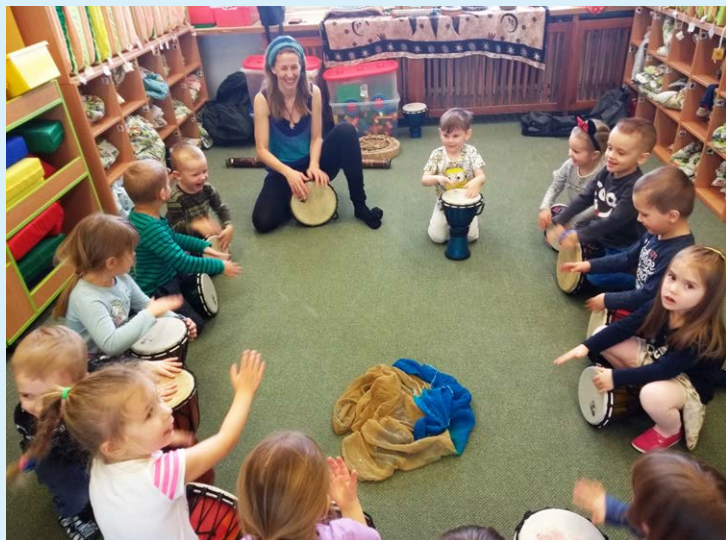
VÍTÁNÍ JARA. Děti zkoušely netradiční nástroje.