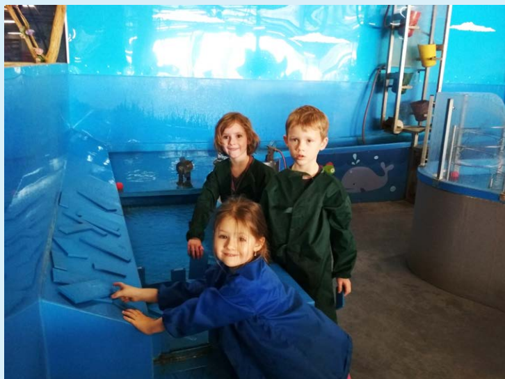
HRY. Děti byly nadšené a plně elánu.