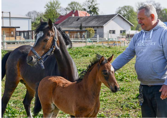
WELSH. Speciální plemeno malých sportovních koní pro děti. U Ostravice se rodí první hříbata.

Koně neposkytují dětem pouze zábavu a poučení, ale současně je vychovávají ke vztahu k přírodě a zvířatům. Pomáhají jim řešit celou řadu neduhů počínaje psychickými depravacemi, poruchami chování, pohybovými vadami... Při účasti pěstouna a svěřeného dítěte se