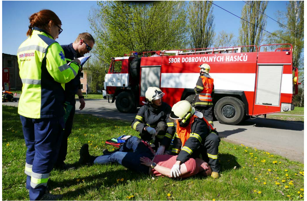
VÝCVIK. Během cvičení si hasiči zkoušeli různé formy první pomoci.