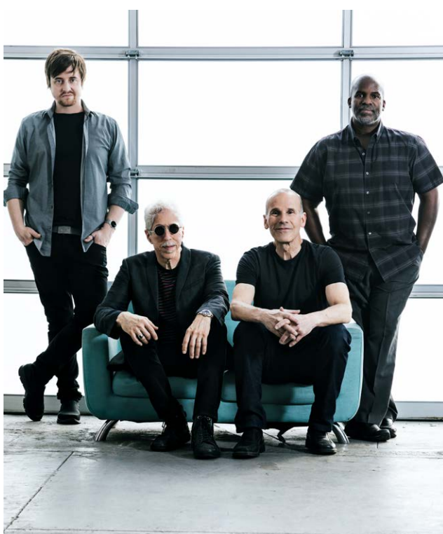
YELLOWJACKETS. Hlavní hvězdy Jazz Open Ostrava 2019.