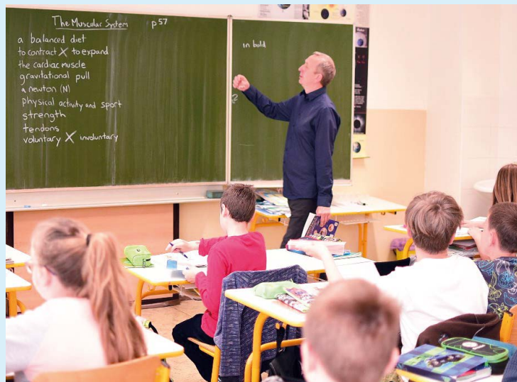
ANGLIČTINA. Žáci si zvyšují sebevědomí během komunikace v cizím jazyce.