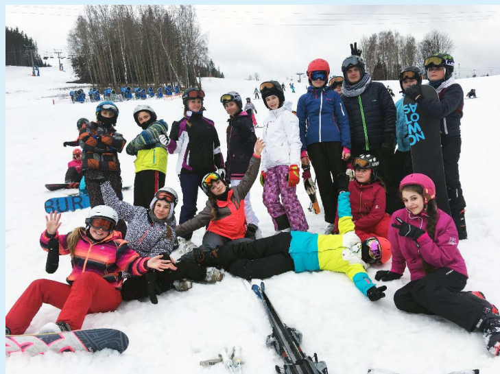
V KARLOVĚ. Ozdravný pobyt muglinovské školy.