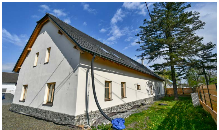
REKONSTRUOVÁNO. Někdejší usedlost na Rajnochově ulici prošla v uplynulých pěti letech zásadní rekonstrukcí. Nyní slouží mimo jiné pěstounským rodinám.