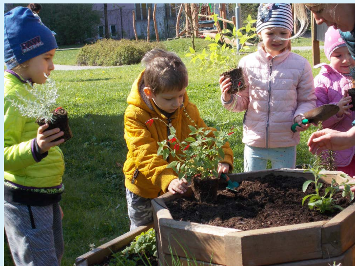
POZNÁVÁNÍ. Děti se věnovaly bylinkám a jiným rostlinám.