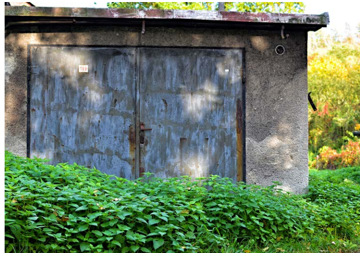
CO S NIMI? Neutěšený stav garáží ve Slezské Ostravě.

V zájmu vedení našeho obvodu je řešit i nadále stav garáží tam, kde dochází k rušení veřejného pořádku, proto budeme rádi i za