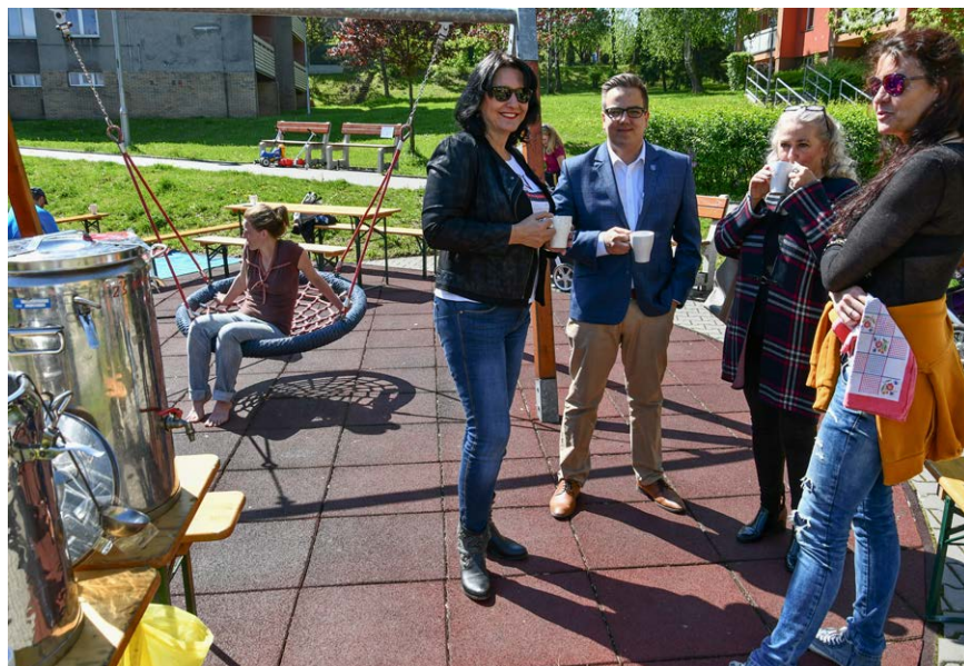
SLAVNOST. Muglinovské setkání na sídlišti.