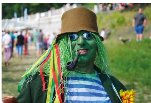
PŘIJDE I VODNÍK? Slavnosti řeky Ostravice se každoročně stávají přehlídkou nejrůznějších masek.

Akci společně připravují městské obvody Slezská Ostrava a Moravská Ostrava a Přívoz. Vše letos začne již úderem 14 hodiny. Jednou z největších atrakcí slavností je každoroční soutěž netradičních plavidel. Posádky se mohou hlásit Centru kultury a vzdělávání v Moravské Ostravě, a to až do data konání akce. Odborná porota pak během slavností hodnotí schopnost plavidla plout mezi soutokem Ostravice s Lučinou a Mostem Miloše Sýkory. Hodnocena je rovněž originalita plavidla a také originalita vzhledu posádky. Ceny jsou lákavé, za první místo dostane nejlepší posádka 15 tisíc korun. Odměny v rádech tisíců se vyplácejí také za další umístění.