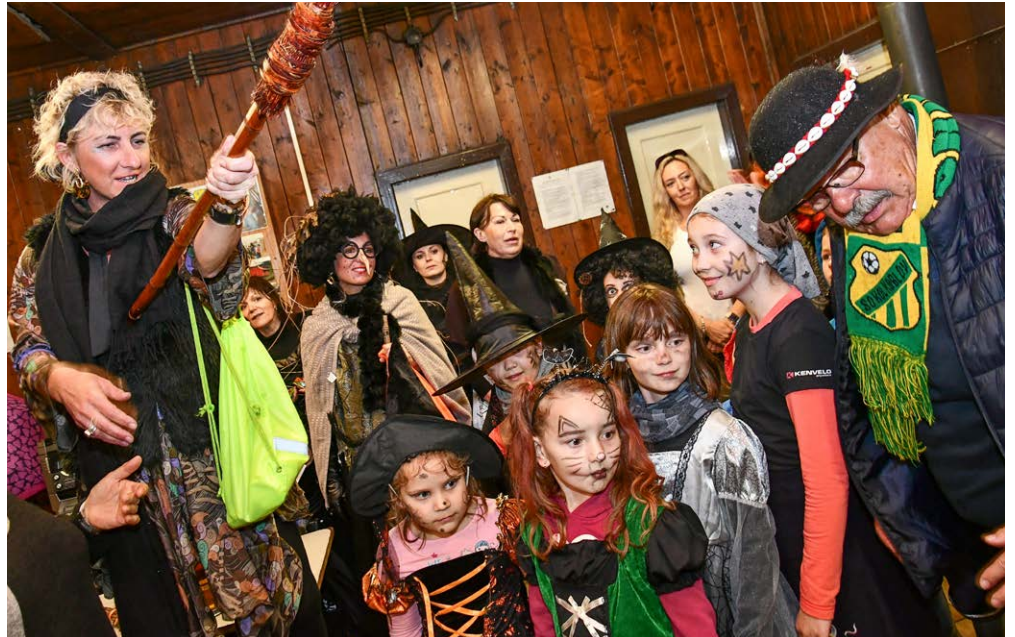
KTERÁ JE NEJLEPŠÍ? Čarodějnice obsadily sokolovnu v Koblově.