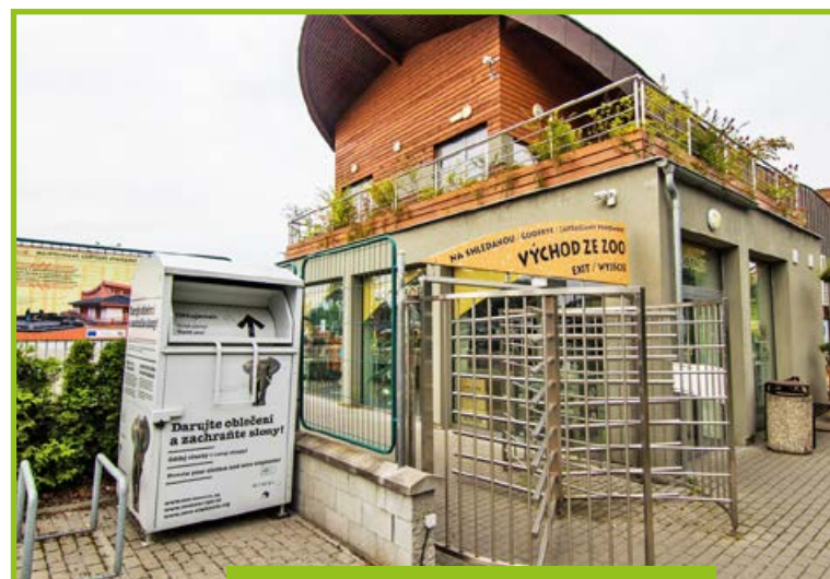
Kontejner na textil u východu ze zoo

Pro předání oděvů do kontejneru můžete v případě uzavření zoo zazvonit na vrátnici.