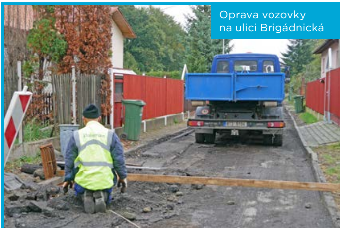
Oprava vozovky na ulici Brigádnická