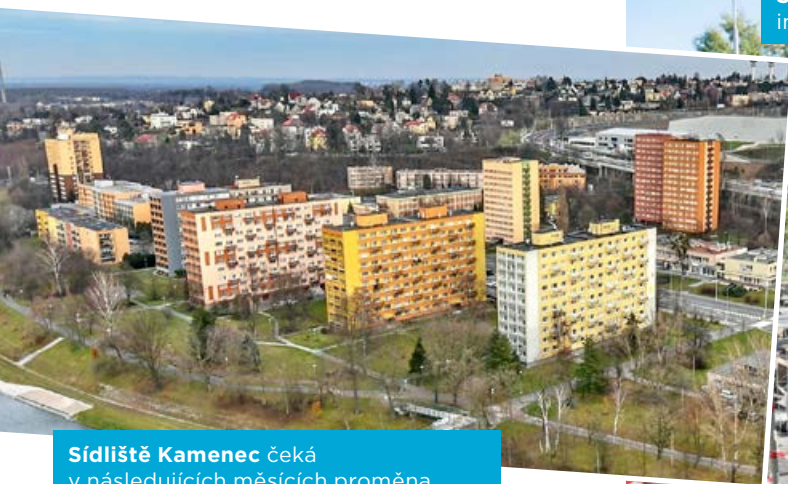
Sídliště Kamenec čeká v následujících měsících proměna.

O zahájení výdeje parkovacích karet budeme informovat v následujícím čísle Slezskoostravských novin, na facebooku i webových stránkách.