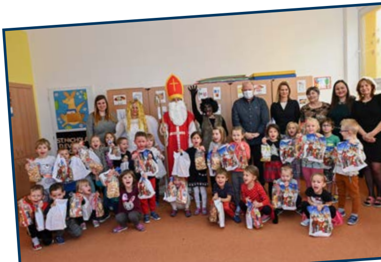
Pohádkové bytosti nevynechaly ani MŠ Záměstní.