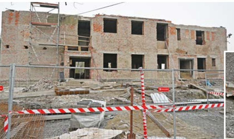
Kontrolní den. Budova bývalé mateřské školy prochází razantní proměnou.