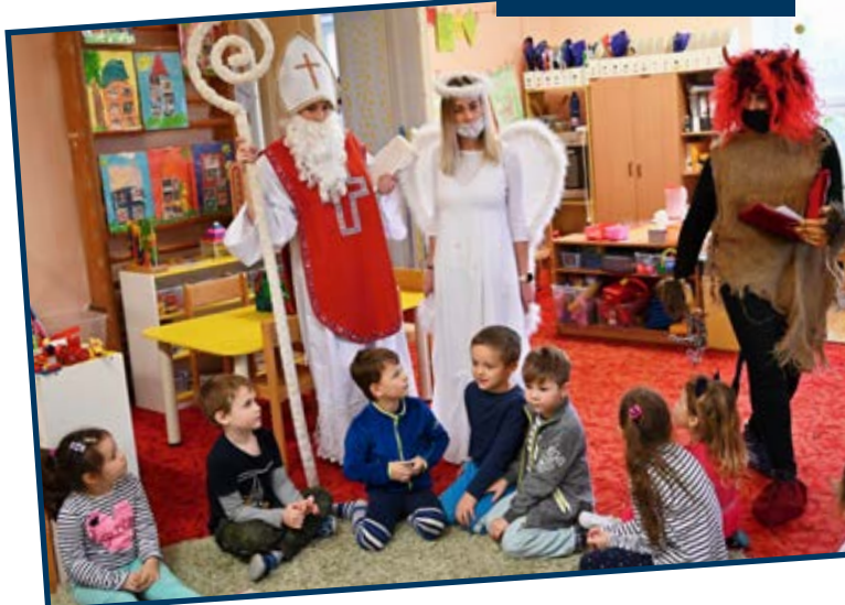
Nadílka v MŠ Požární.