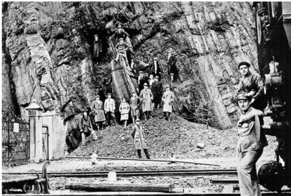
Na dobové fotografii jsou patrné výchozy uhelných slojí u Dolu Anselm, které jsou geologickým unikátem.

Dnes, poučen množstvím odborné literatury a informacemi o tomto bájném vrchu vím, že Landek je nejen dominantou nejstarší historie Ostravy, ale také učebnicovým obrazem horského masivu prastarého geologického útvaru - a hlavně sídlištěm lovců mamutů starého 30 000 let. Zde, na tomto místě, můžeme vystopovat i počátek souhry člověka s přírodou. Na příkrém svahu Landeku se totiž nacházejí jedny z největších uhelných slojí v Evropě, které vystupují na povrch a některý z našich dávných předků uhlí použil jako palivo.