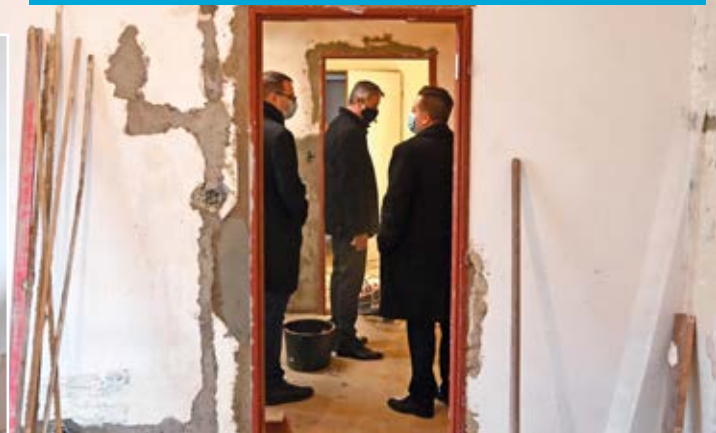
Byty na ulici Koněvova procházejí kompletní modernizací.

Stavební firma zajistí oddrenážování domů v úrovni základové spáry, novou dešťovou kanalizaci, opravu vodovodní, kanalizační a plynovodní přípojky. Náklady na tuto opravu, která bude pokračovat i roce 2021, budou činit 1,8 milionu korun.