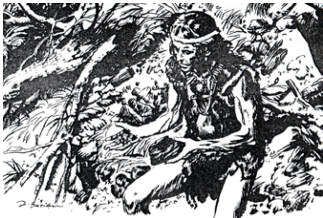
Ilustrace k povídce Josefa Augusty Černý kámen.

venuše, zaujal i profesora Josefa Augusty, který o landeckém příběhu napsal povídku Černý kámen, která byla otištěna v širěji pojaté knize U pravěkých lovců /Státní pedagogické nakladatelství Praha 1971/. Kniha je bohatě ilustrována a k landeckému příběhu nakreslil perokresby nenahraditelný umělec pravěkého života Zdeněk Burian.