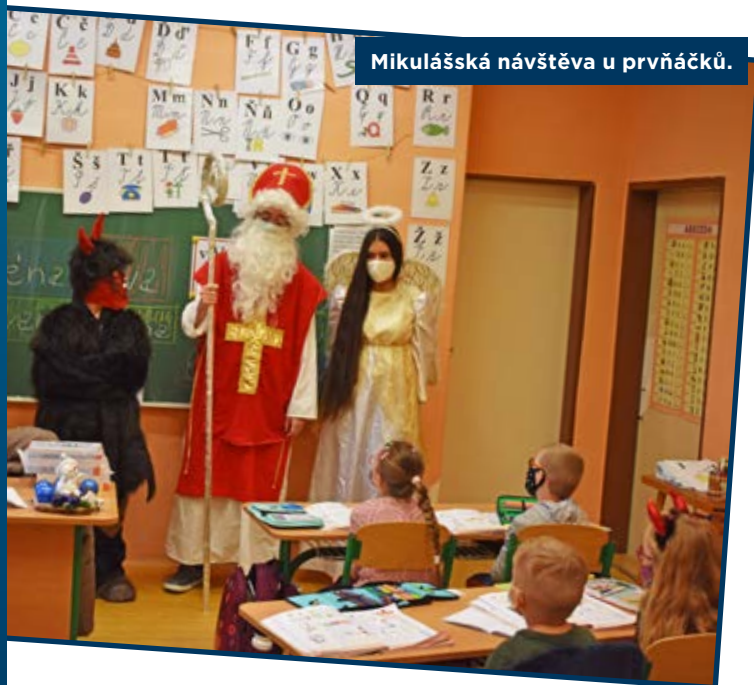
Mikulášská návštěva u prvňáčků.