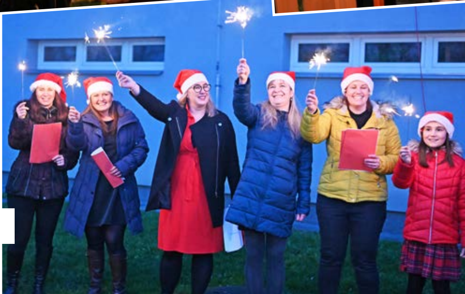
Vánoční slavnost v DPS Hladnovská