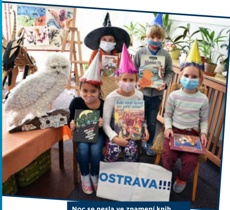
Noc se nesla ve znamení knih o mladém kouzelníkovi.