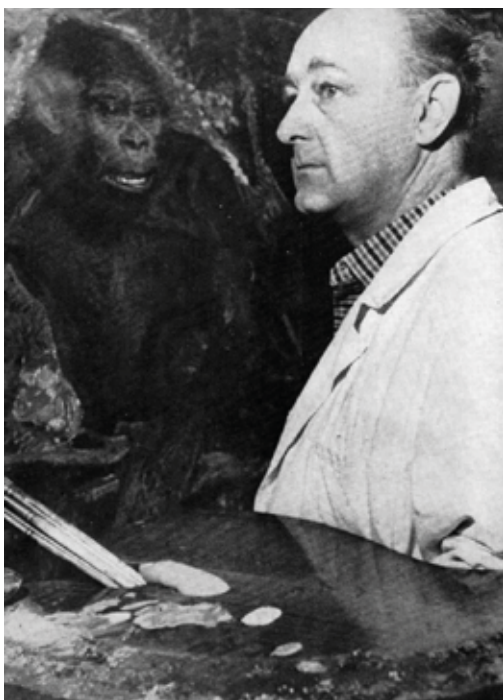
Malíř a ilustrátor zasloužilý umělec ZDENĚK BURIAN * 11. 2. 1905 † 1. 7. 1981

tu štíhlou Landeckou venuši - ale tento rok je zlý. Dělán jen pro Čs. akademii věd 26 olejí - kromě práce na knižních ilustracích obrazů pro cizinu /paleoantropolog. obrazy pro knihy zahranič. vědců/ - takže letos bych se k tomu asi nedostal. Ale schovám Váš dopis, a jakmile bude trochu času, ozvu se sám. To víte, je mi skoro 72 let a čím jsem starší, tím více práce..."