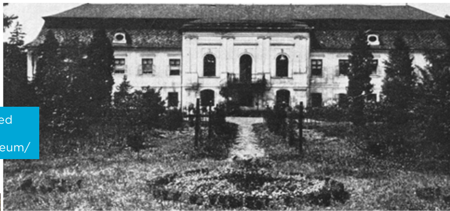
Zámek v Kunčičkách před rokem 1930