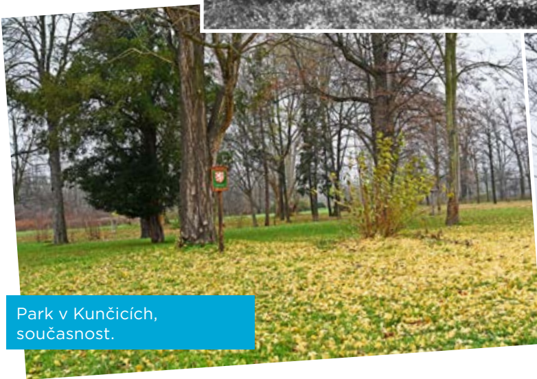
Park v Kunčičkách, současnost.