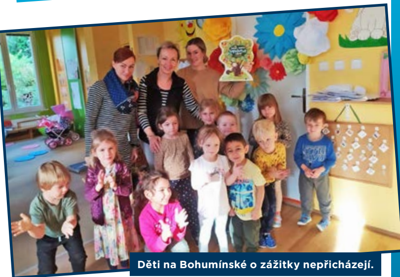
Děti na Bohumínské o zážitky nepřicházejí.