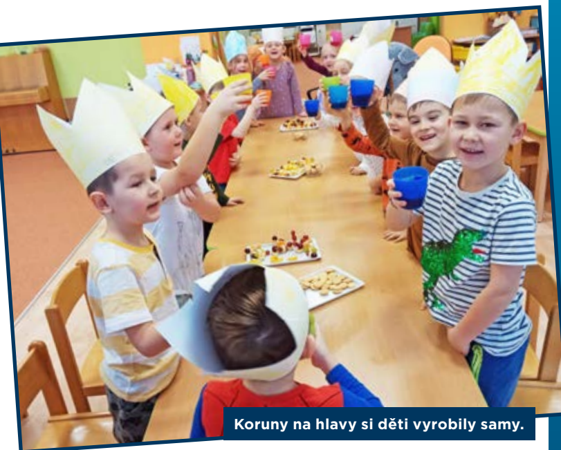
Koruny na hlavy si děti vyrobily samy.