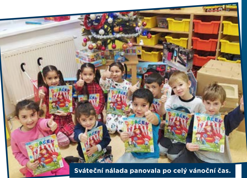
Sváteční nálada panovala po celý vánoční čas.