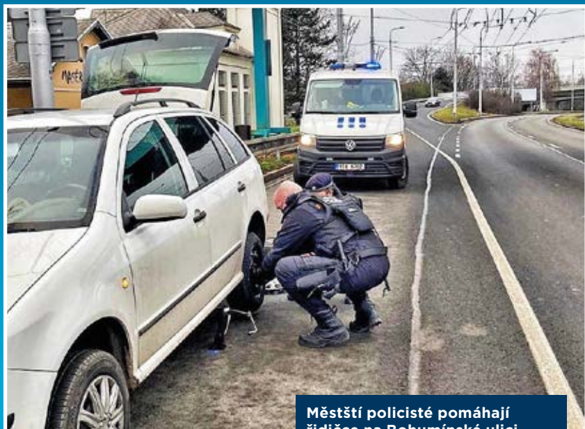
Městští policisté pomáhají řidičce na Bohumínské ulici.

Strážníci proto neváhali, přiložili ruce k dílu a řidičce pomohli kolo vyměnit. Po krátké chvíli tak řidička mohla pokračovat dále v jízdě.