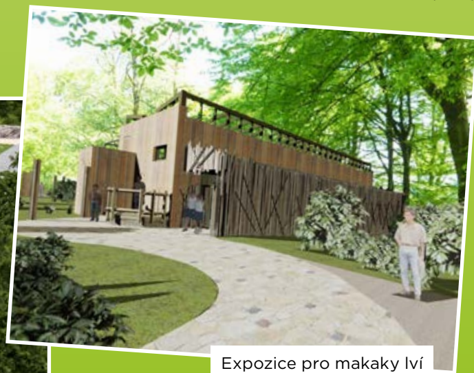
Expozice pro makaky lví