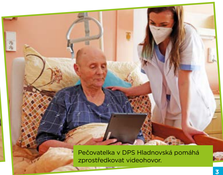
Pečovatelka v DPS Hladnovská pomáhá zprostředkovat videohovor.