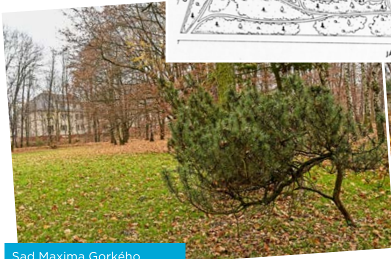
Sad Maxima Gorkého v Kunčičkách, současnost.