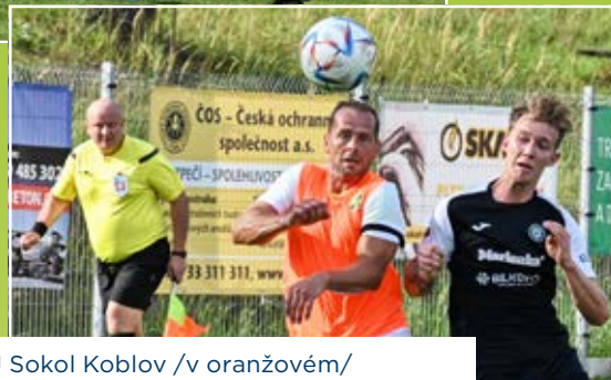
Mužstvo TJ Sokol Koblov /v oranžovém/ porazilo FC Vratimov vysoko 5:1.