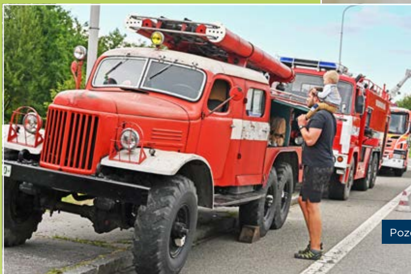
Pozornost malých i velkých přitahoval sovětský ZIL.