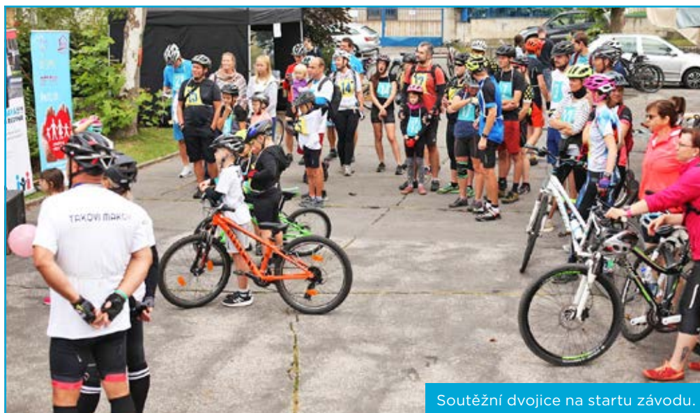
Soutěžní dvojice na startu závodu.

Závodníci, kteří přijeli do cíle všichni a v pořádku, si domů odnášeli pamětní medaile, poháry a hodnotné ceny.