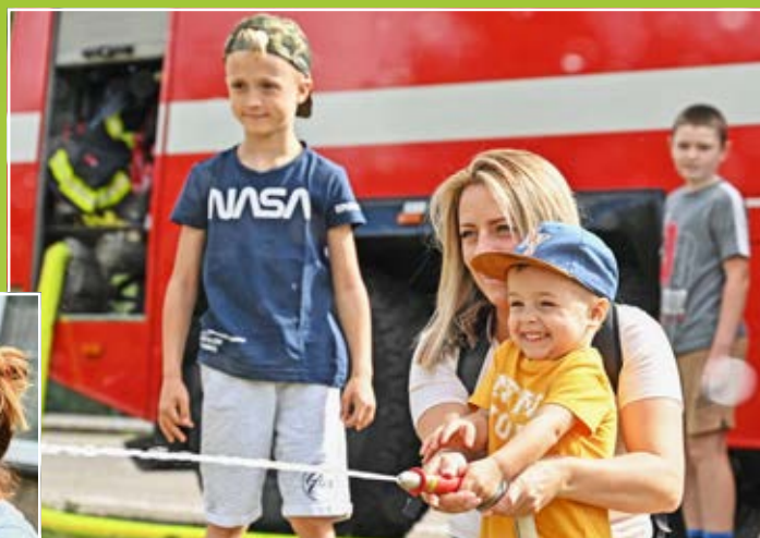
Děti soutěžily v nejrůznějších disciplínách.