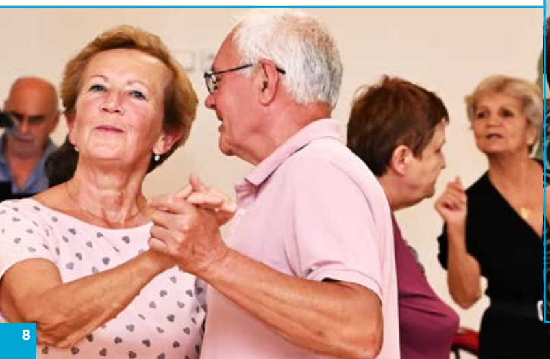
Senioři ochutnávali dobré víno, jídlo, zapívali si i zatancovali.