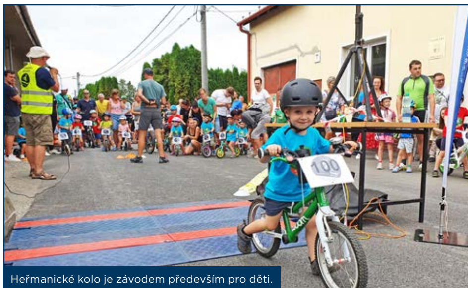
Heřmanické kolo je závodem především pro děti.

manického pivovaru a hlad se dařilo zasytit výtečným gulášem nebo párky. Bohužel došlo i na několik zranění, díky každoroční přítomnosti zdravotníků byly tyto úrazy okamžitě a profesionálně ošetřeny. Dokonce letos přijela Česká televize natočit o závodech reportáž, kterou jste mohli zhlédnout v Událostech z regionů.