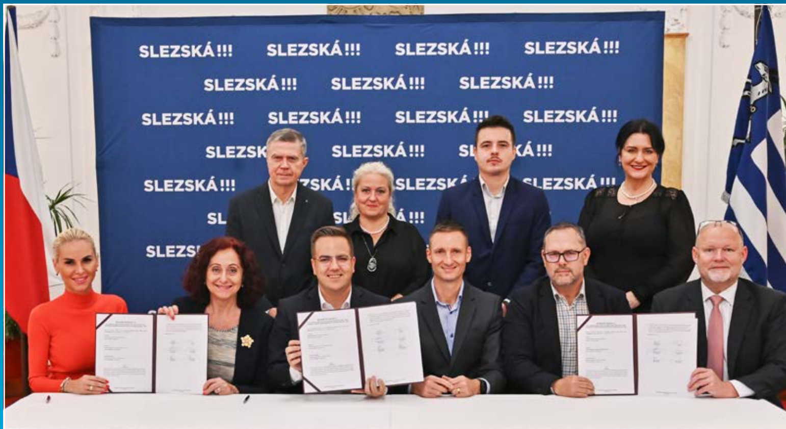
Podpis koaliční smlouvy v obřadní síni slezskoostravské radnice.