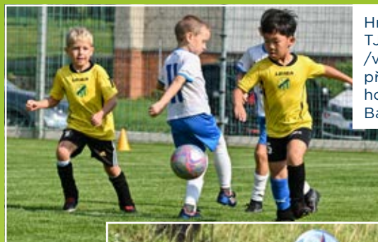
Hráči domácích TJ Sokol Koblov /ve žlutém/ připravili o míč hostující TJ Baník Ostrava.