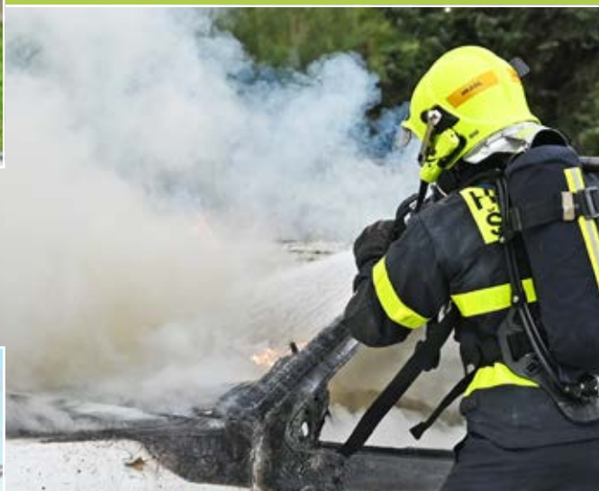
Hasiči bojovali s plameny hořícího vraku.