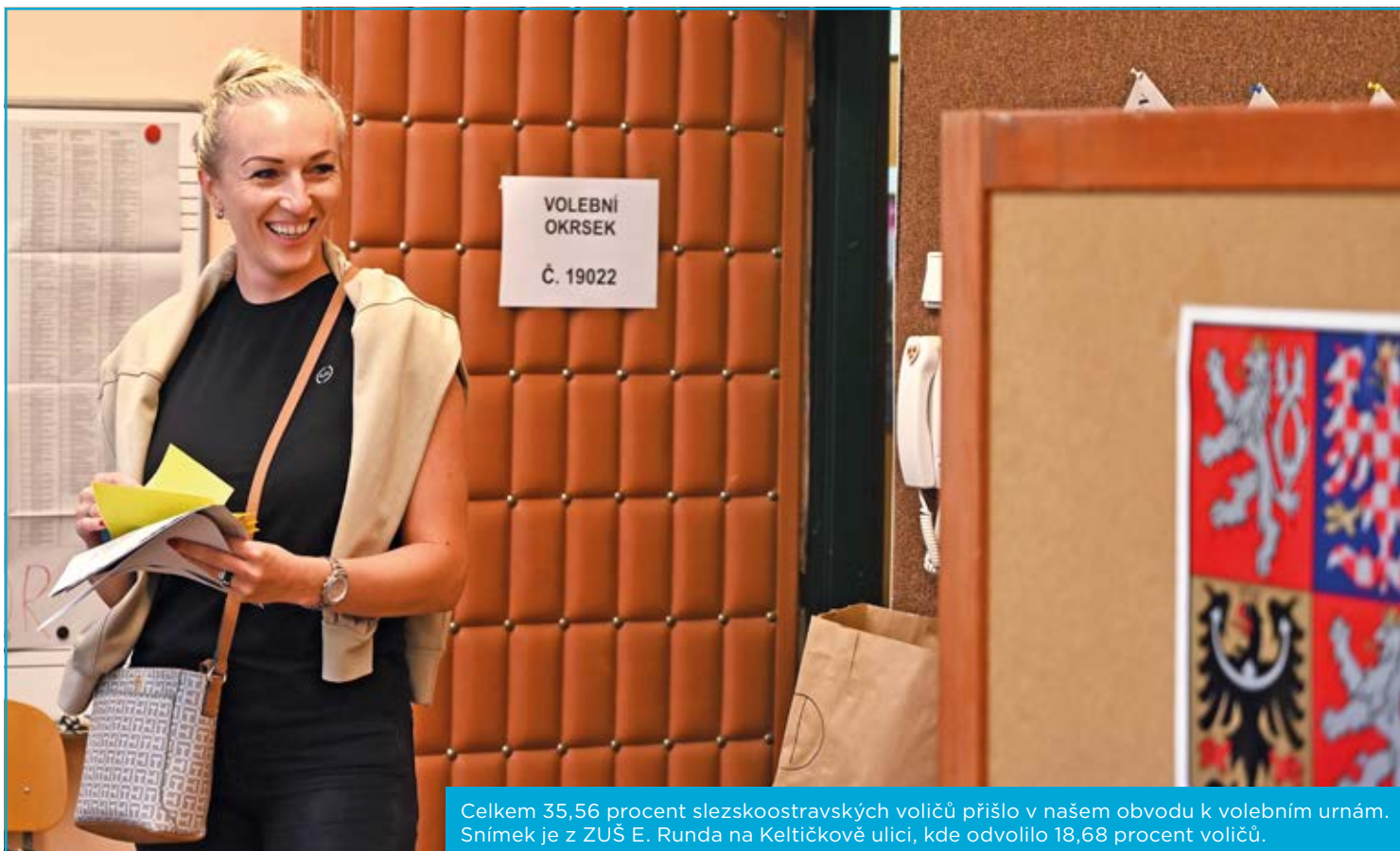
Celkem 35,56 procent slezskoostravských voličů přišlo v našem obvodu k volebním urnám. Snímek je z ZUŠ E. Runda na Keltičkově ulici, kde odvolilo 18,68 procent voličů.