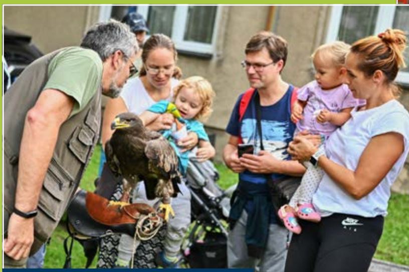
Sokolníci předvedli v Muglinově své dravce.