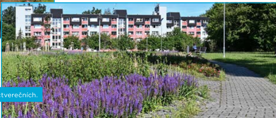
Park Hladnovská má plochu zhruba tři tisíce metrů čtverečních.