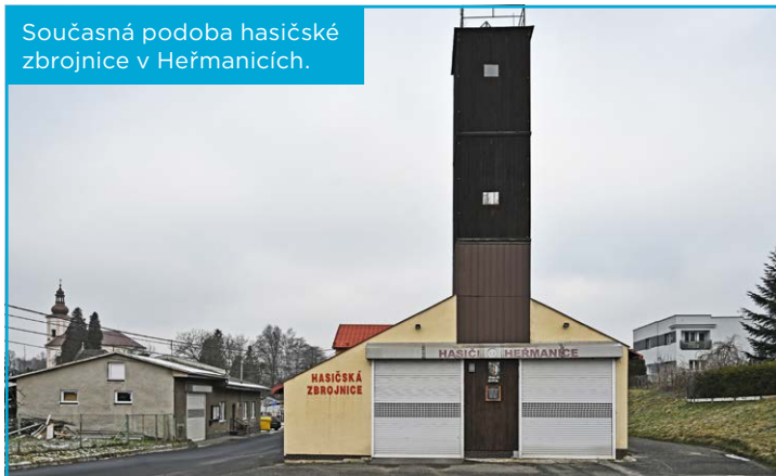
Současná podoba hasičské zbrojnice v Heřmanicích.