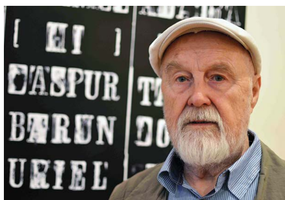
Eduard Ovčáček. Vizuální básník, grafik, sochař, malíř, fotograf, typograf, kurátor a vysokoškolský pedagog.

„Eduard Ovčáček podstatnou část svého života spojil s Ostravou a výrazně se zapsal do poválečných dějin nejen Ostravska. Zejména tvůrčí hodnota jeho díla z něj učinila skutečnou součást městských, regionálních, československých i evropských dějin. Stal se ústřední postavou, která propojila umění druhé poloviny 20. století se současným uměním,“ říká o umělci ředitel GVUO Jiří Jůza.