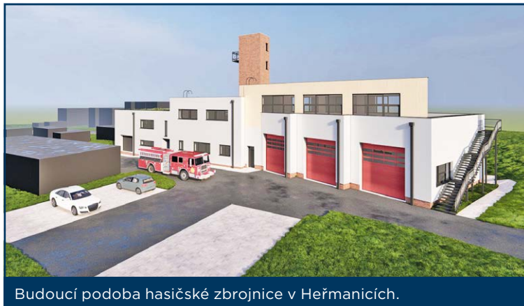
Budoucí podoba hasičské zbrojnice v Heřmanicích.