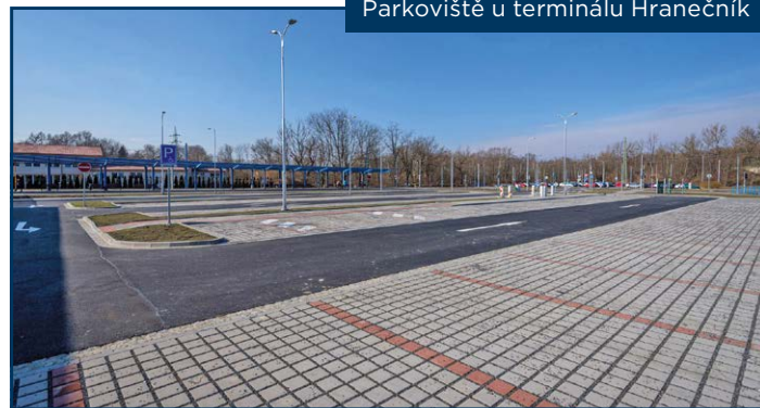
Parkoviště u terminálu Hranečnick

Přestupní terminál Hranečnick slouží k přestupu z meziměstských autobusových linek a osobní automobilové dopravy na linky MHD. Jsou na něm nástupiště veřejné dopravy, budova městské policie, čekárna a veřejná toaleta.