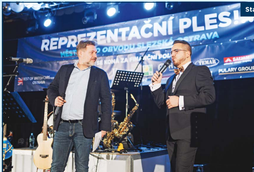
Starosta Richard Vereš zahajuje ples Slezské Ostravy v Trojhalí.

„Tombola bývá na slezskoostravském plese bohatá každoročně. A to zejména díky našim sponzorům, kteří poskytují nejen finanční dary, ale i jednotlivé dary do tomboly. Proto si myslím, že tombola na našich plesech patří mezi jednu z nejlepších tombol na Ostravsku,“ uzavřel starosta Richard Vereš.