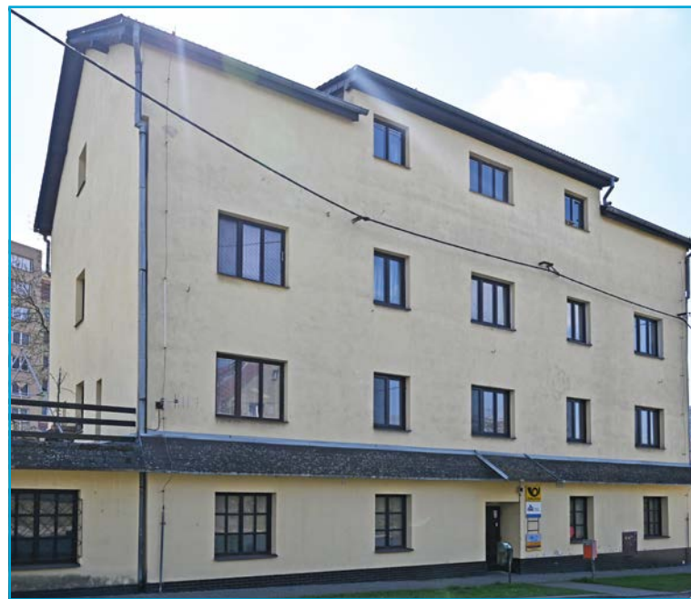
Pobočka České pošty v Muglinově. Od 1. července se má stát jedinou fungující pobočkou pošty v celé Slezské Ostravě.

museli cestovat za svojí poštovní zásilkou 30 nebo 40 minut,“ popisuje poslední vývoj událostí slezskoostrovský starosta.