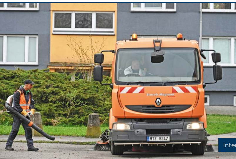
Intenzivní čištění Slezské bylo letos zahájeno v oblasti sídliště Kamenec.

O termínech a místech rajónového čištění jsou občané obvodu informováni na webových stránkách i Facebooku městského obvodu a rovněž ve Slezskoostrovských novinách. Před vlastním čištěním jsou dané úseky týden dopředu označeny příslušnými dopravními značkami s upozorněním, aby zde řidiči neparkovali.