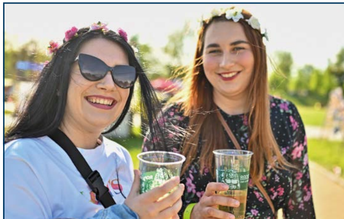
Sobota 13. května bude na Slezskoostravském hradě patřit Studentskému Majálesu.

„Těší mě, že se Majáles před několika lety vrátil na Slezskoostravský hrad a zařadil se mezi tradiční akce, které se zde konají. Ze strany městského obvodu může tato akce počítat nejen s finanční podporou. Jsme hrdými partnery této akce. Zatímco v řadě měst se Majáles stal ryze komerční akcí, v Ostravě se stále