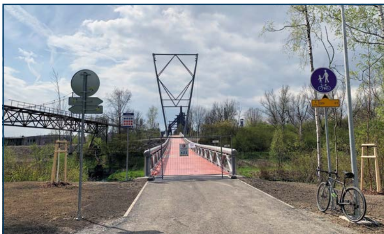
Nová lávka pro pěší i cyklisty spojí Slezskou Ostravu s Dolní oblastí Vítkovic.