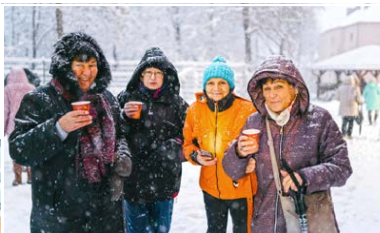
Vánoční setkání seniorů v Domě s pečovatelskou službou Heřmanická.