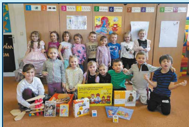
Během projektu se děti pomocí jazykových chviliek seznamují hravou formou s anglickým jazykem v každodenních činnostech.