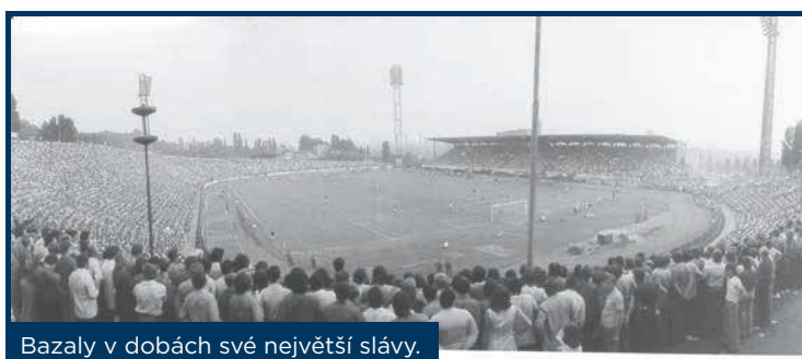
Bazaly v dobách své největší slávy.

O přestavbě Bazalů se uvažovalo již v roce 2012, kdy noví majitelé klubu představovali na zasedání zastupitelstva Slezské Ostravy své plány. Stadion měl být částečně zastřešen, s příkrými tribunami, kde by diváci byli blíže k hřišti. V ochozech měly vzniknout obchody. Z plánů nakonec nezbylo nic. Baník finančně skomíral a město v roce 2013 stadion odkoupilo, aby zabránilo bankrotu klubu. Bazaly pak nechalo město Ostrava přestavět do současné podoby tréninkového areálu.