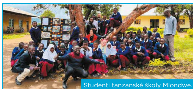
Studenti tanzanské školy Mlondwe.

A pro více otázek neváhejte napsat na email: hakunamatateuk@gmail.com