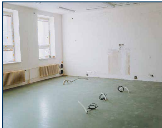
Rekonstrukce učeben na ZŠ Pěší.

Rekonstrukcí prošly v uplynulých měsících na ZŠ Pěší také třídy školní družiny. Mají zde i nové židle, na kterých lze díky jejich tvaru a stabilitě sedět i „naopak.“