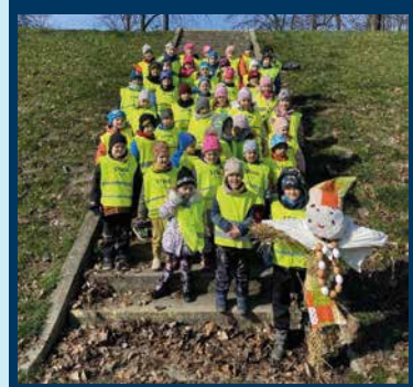
Morena přinesena k řece Ostravici.