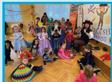
Karneval v muglinovském kulturním domě.