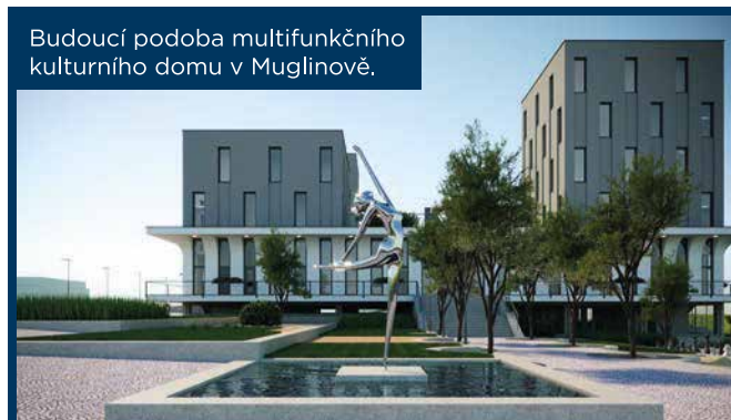
Budoucí podoba multifunkčního kulturního domu v Muglinově.