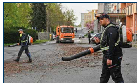
Rajónové čištění Slezské Ostravy bylo zahájeno na sídlišti Kamenec.

Při rajónovém čištění jsou používány silniční zametací vozy Tajfun, chodníkový zametač a fukary, které čistí plochy v místech, kam se silniční zametací vozy kvůli své značné velikosti nedostanou.