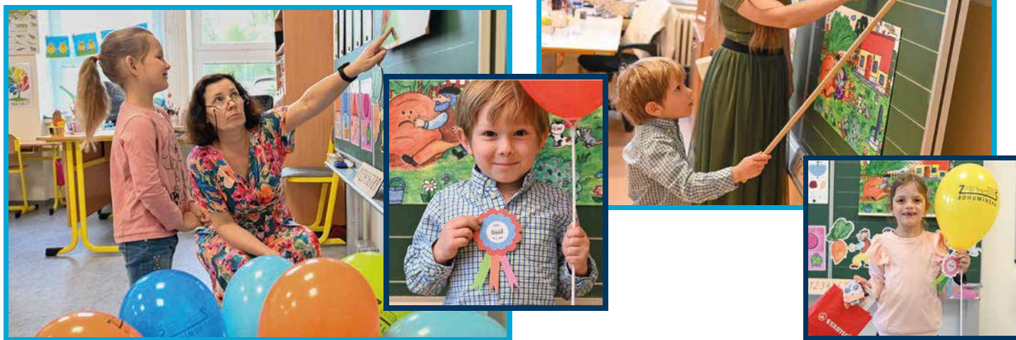
Budoucí prvňáčci během zápisu na ZŠ Bohumínská.

Městský obvod pravidelně investuje také do úprav školních zahrad nebo výstavby nových školních hřišť.