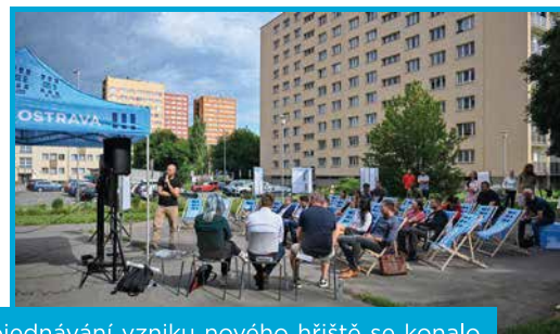
Veřejné projednávání vzniku nového hřiště se konalo přímo na místě loni 27. července.

Vybudování nového hřiště má stát zhruba tři miliony korun, investorem je městský obvod Slezská Ostrava.