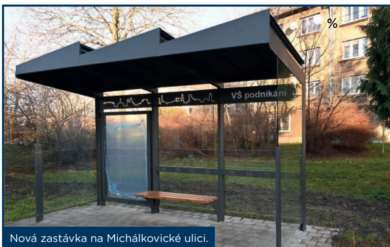
Nová zastávka na Michálkovické ulici.