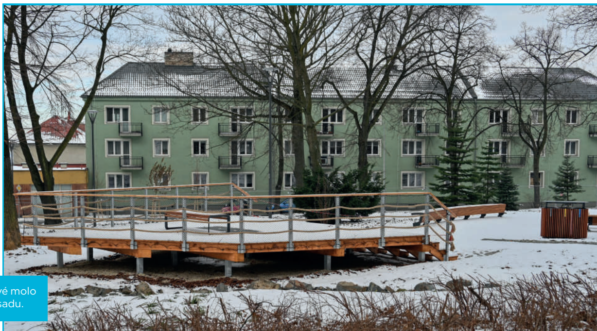
Nové odpočinkové molo již stojí v Tylově sadu.

V sadu vzniká nové odpočinkové dřevěné molo, stejně jako nové pěší trasy. To vše bude doplněno novým městským mobiliářem. Staré asphaltové chodníky střídají zpevněné plochy z žulových dlažeb a mlatu. S příchodem teplejšího počasí projekt počítá s výsadbou nové zeleně, vysazeny budou konkrétně lípy, javor, habr, jírovice i nové keře. V sadu rovněž vznikne motýlí a pobytová louka. Samozřejmostí je nové veřejné osvětlení. Po obvodu parku se počítá s pokládáním nových obrubníků a souvisejícího asphaltového povrchu. Proměna Tylova sadu je společným projektem městského obvodu Slezská Ostrava, města Ostravy a Ostravské univerzity.