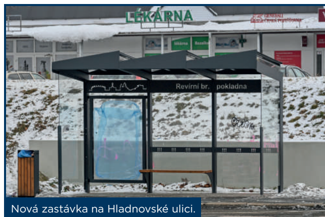
Nová zastávka na Hladnovské ulici.