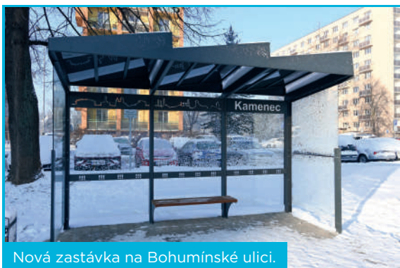
Nová zastávka na Bohumínské ulici.

„Všechny tyto zastávky mají jednotný design, který zobrazuje ostravské dominanty. Stávají se novými ozdobami Slezské Ostravy. Od občanů máme na novou moderní podobu zastávek velmi kladné ohlasy,“ říká starosta Richard Vereš.