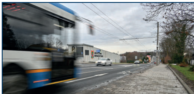
Nové chodníky, opravy zastávek MHD, nový povrch vozovky. Michálkovická ulice ve Slezské Ostravě se postupně rekonstruovala od loňského dubna, nyní je vše hotovo.

Michálkovická ulice je jednou z hlavních tepen Slezské Ostravy, navíc po ní přicházejí tisícové návštěvy do zoo. Loni do ní zamířilo přes 600 tisíc návštěvníků. „Je důležité nezvelebovat jenom samotnou zahradu, ale i její okolí. Rekonstrukce přístupových cest i chodníků na Michálkovické ulici se povedla, což návštěvníci jistě ocení,“ konstatuje mluvčí zoo Šárka Nováková.